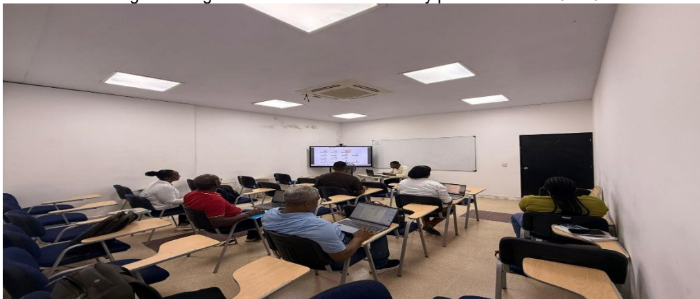
Registro fotográfico reunión de evaluación y planificación 24-04-26