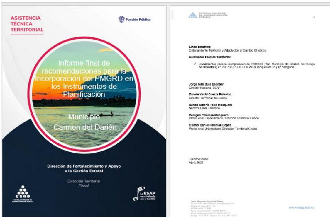
Portada documento técnico final aprobado de ATT del municipio de Carmen del Darien

Acogiendo los lineamientos de la matriz ANS y de los documentos técnicos, como parte de las actividades de los entregables de las AT de las Líneas Temáticas Ordenamiento Territorial, realice la elaboración y entrega del documento técnico final de la AT en “Informe final con las recomendaciones para la incorporación del PMGRD en los instrumentos de planificación según los lineamientos establecidos en la Ley 1523”, siendo esta aprobada por los líderes temáticos y corresponde a la ATT entregadas en el primer corte.