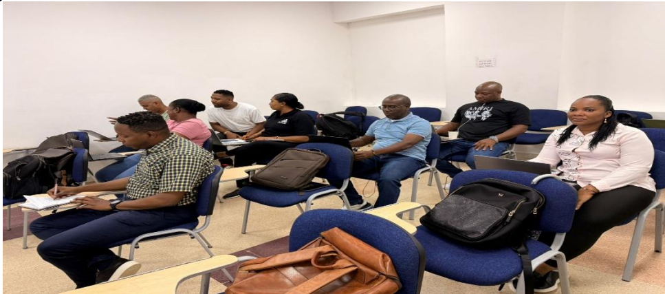
Registro fotográfico reunión de evaluación y planificación 10-04-26

En los días 10,17 y 24 de abril participe de las reuniones de evaluación y planificación programadas por el líder territorial, en las cuales se socializa la información de avances, dificultades y se proponen acciones que propendan por el adecuado desarrollo de la estrategia de ATT, siendo esta realizada todos los viernes.