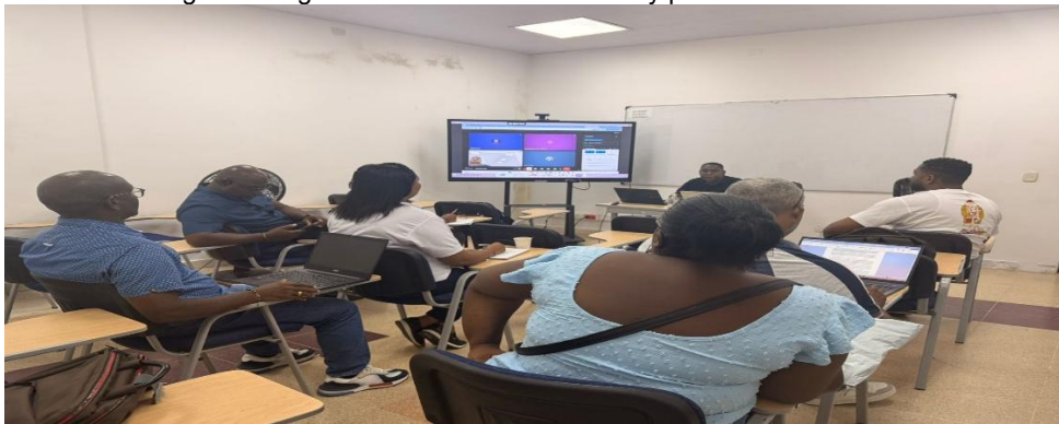
Registro fotográfico reunión de evaluación y planificación 17-04-26