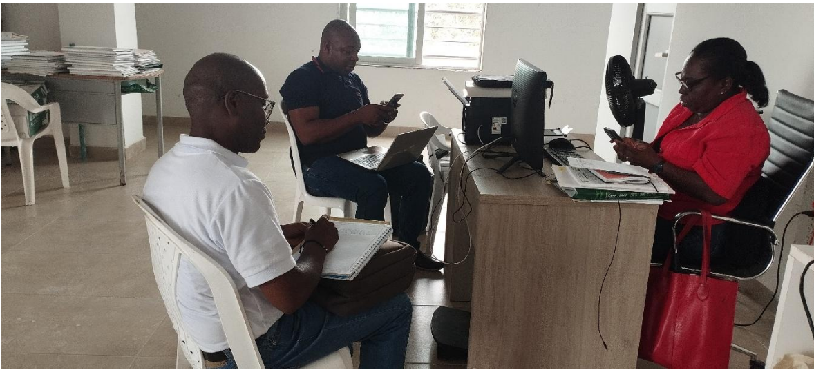
Pantallazo de reunión de presentación de oferta académica e institucional de la ESAP a funcionarios del municipio de Nuevo Belen de Bajirá

En desarrollo del proceso la visita de campo al municipio de Nuevo Belen de Bajirá, el 29-30/04/2026 y 01/05/2026, en el marco de la mesa de trabajo para la recolección de la información el desarrollo de las herramientas diagnosticas par las ATT, se realizó la presentación de la oferta académica e institucional de la ESAP, dando una especial divulgación a la oferta académica que se encuentra abierta hasta el 15 de mayo.