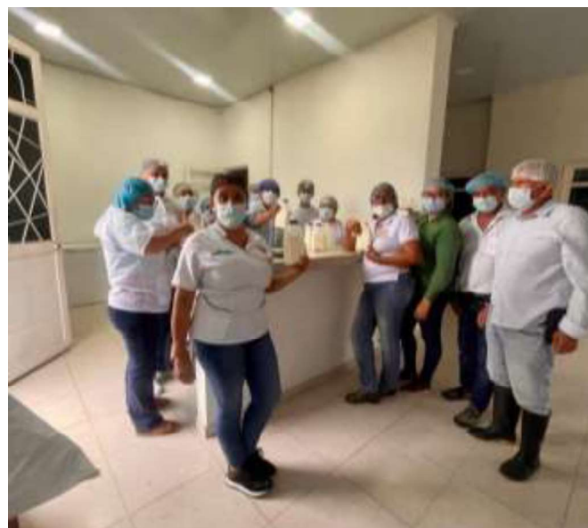
Lugar: centro de estudios (sena)