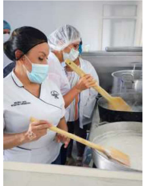
Lugar: casa de la mujer

PUBLICACION EN EL LA PAGINA DE ASOPOLET https://www.facebook.com/reel/1777641243217156