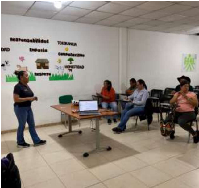
Lugar: centro de estudios (sena)