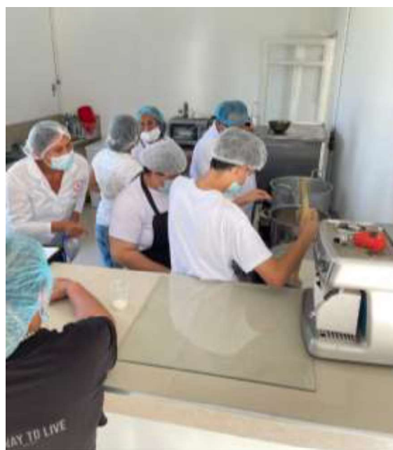
Lugar: centro de estudios (sena)