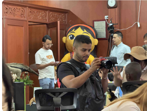
Acompañamiento a la producción, edición y difusión de material fotográfico.