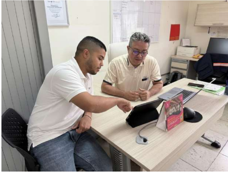
ANEXO 2: Contribuyendo al fortalecimiento de la comunicación informativa y al cumplimiento de los objetivos.