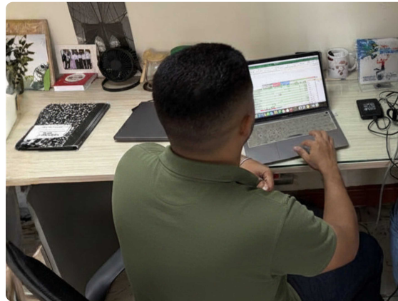
Seguimiento de actividades y procesos asignados, con el fin de darle cumplimiento al cronograma de las tareas del mes de Mayo.