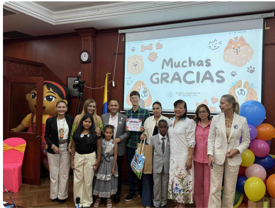
Proceso audiovisual, fotográfico y logístico.