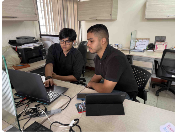
Edición audiovisuales del proceso de Planeación e Información Institucional.