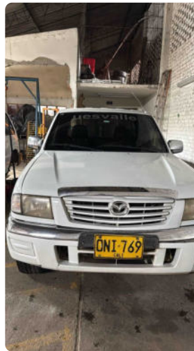
ENTREGAR VEHICULO LIMPIO DESPUES DE LA RUTA