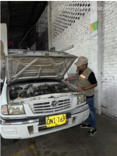
REVISION DE LOS VEHICULOS ANTES DE COMENZAR LA RUTA DIARIA