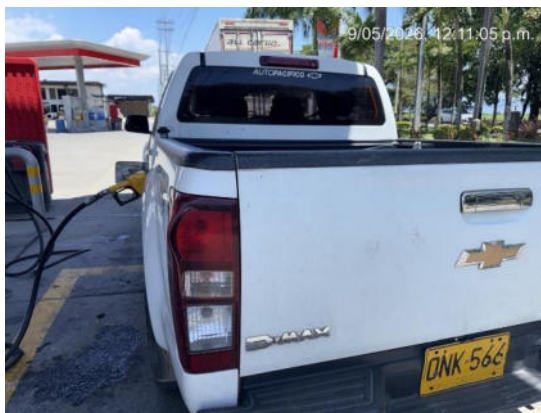
TANQUEO DE LOS VEHICULOS CUANDO ES NECESARIO