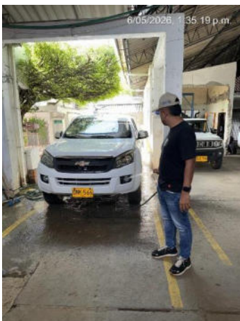
LIMPIESA DE LOS VEHICULOS CUANDO SE TERMINA LA RUTA