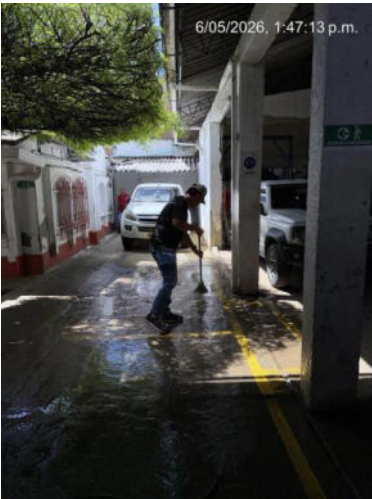
APOYO A RECURSOS FISICOS ASEANDO EL PARQUEADERO