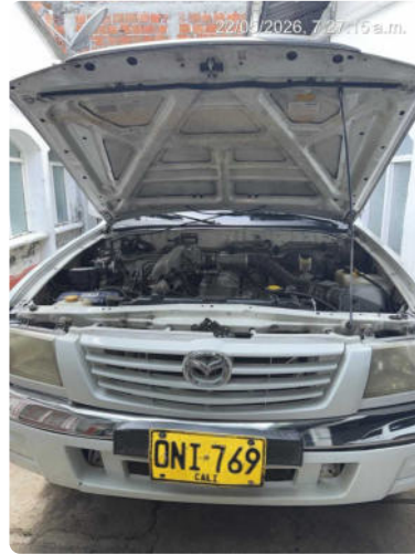
REVISION DIARIA DEL VEHICULO PARA SALIR A LA RUTA