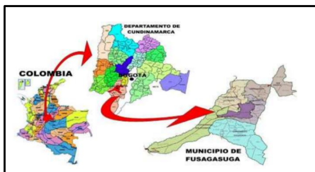
Ilustración 1. Ubicación Fusagasugá.

La ejecución del objeto contractual se llevará a cabo en el casco urbano y rural del Municipio de Fusagasugá, Cundinamarca.