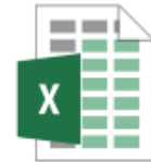
Caja Menor Vig2026

Texto resumen: Registré en el archivo de Excel de caja menor las facturas correspondientes a las compras realizadas durante los meses de abril y mayo, así como los demás gastos efectuados hasta la fecha, con el fin de mantener un adecuado control y soporte de la información financiera.