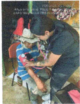
Anexos 9 registro fotográfico