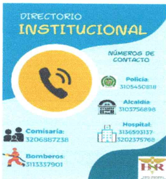
Anexos 5 red intersectorial de actores