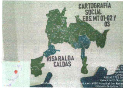
Anexos 2 Evidencia fotográfica de la cartografía