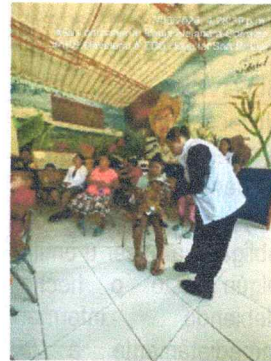
Anexos 4 Evidencia fotográfica sobre educacion