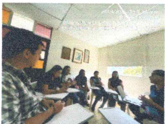
Anexos 7 acta de sesión grupal y evidencia fotográfica)