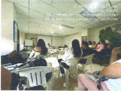
Anexos 1 Evidencia de actas de equipos