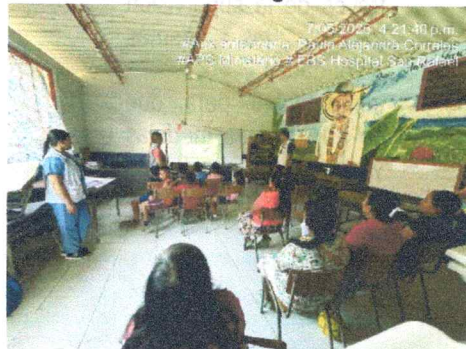
Anexos 6 evidencia fotográfica