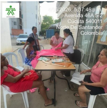
4/05/2026, 5:07:46 p.m. Avenida 46A 5-2 Cúcuta 540011 Norte De Santander Colombia

Para el desarrollo de las actividades de aprendizaje es necesario revisar los componentes formativos desarrollados como apoyo para su proceso de formación. El instructor realizará un acompañamiento de manera presencial, para guiar y orientar el proceso de aprendizaje de algunas situaciones específicas que se deben tener en cuenta para el desarrollo de cada una de las evidencias.