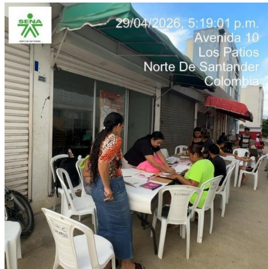
29/04/2026, 5:19:01 p.m. Avenida 10 Los Patios Norte De Santander Colombia

Día 4: 30/04/2026 FICHA - 3490173: Continuamos con el proceso de formación con la Simbología en Patronaje. El Aprendiz debe apropiarse del conocimiento de la simbología en Patronaje se realiza el Trazo de Básicos de Falda de Dama. Para el desarrollo de esta evidencia, se tienen en cuenta los conceptos de pre-patronaje y Reconocimiento de la estructura corporal y se procede al desarrollo del patronaje según el prototipo elegido.