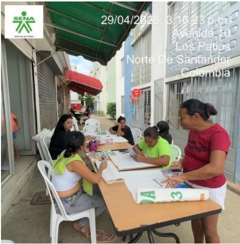
29/04/2026, 3:16:23 p.m. Avenida 10 Los Patios Norte De Santander Colombia