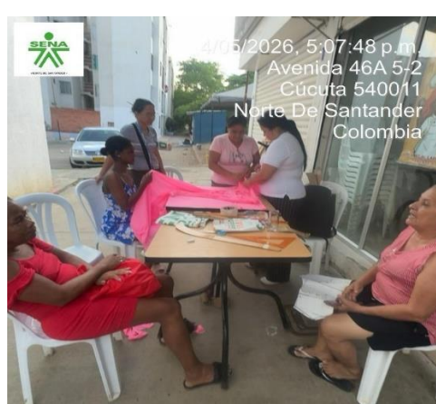
4/05/2026, 5:07:48 p.m. Avenida 46A 5-2 Cúcuta 540011 Norte De Santander Colombia