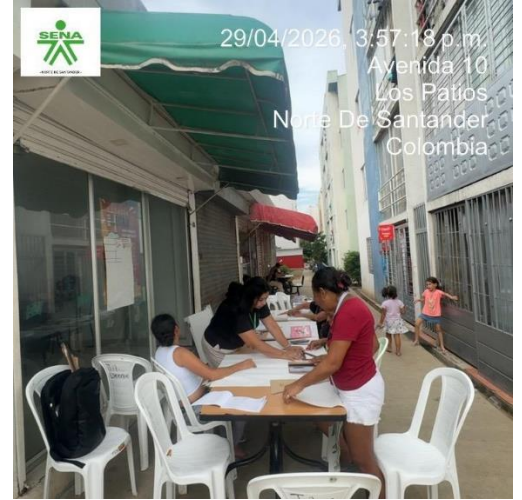
29/04/2026, 3:57:18 p.m. Avenida 10 Los Patios Norte De Santander Colombia

Día 4: 30/04/2026 FICHA - 3490173: Continuamos con el proceso de formación con la Simbología en Patronaje. El Aprendiz debe apropiarse del conocimiento de la simbología en Patronaje se realiza el Trazo de Básicos de Falda de Dama. Para el desarrollo de esta evidencia, se tienen en cuenta los conceptos de pre-patronaje y Reconocimiento de la estructura corporal y se procede al desarrollo del patronaje según el prototipo elegido.