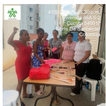
4/05/2026, 5:25:30 p.m. Avenida 46A 5-2 Cúcuta 540011 Norte De Santander Colombia