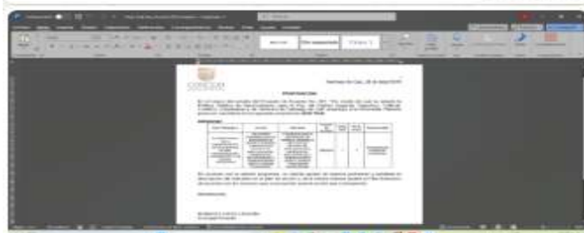
otra proposición Desarrollo Económico 12:28 p. m.