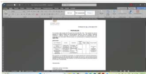
Proposición a Secretaría de Desarrollo Territorial y Participación Ciudadana 12:28 p. m.