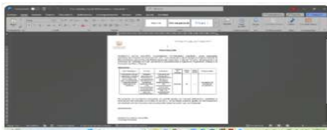
Proposición Desarrollo Económico- Comisión de Plan y Tierra 12:27 p. m.

Concejal, garantizando su adecuada gestión tanto en medios virtuales como presenciales.