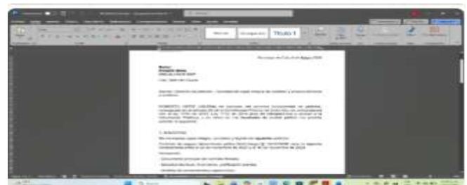
Elaboración de derechos de petición para obtener información 12:24 p. m.