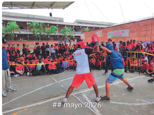
EXHCIBION DE BOXEO EN LA INSTITUCION EDFUCATIVA OCCIDENTE