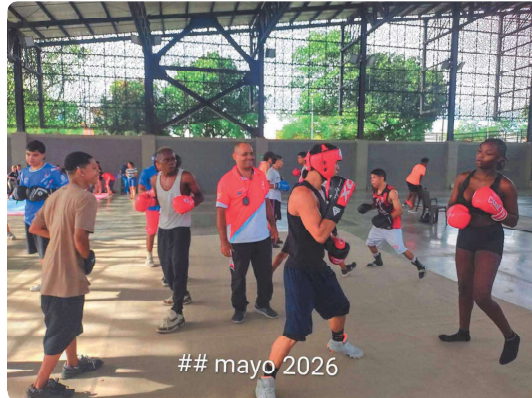
ESCUELA DE COMBATE DIRIGIDA

Informe actividades Contrato # IND-26-1489 de 2,026.