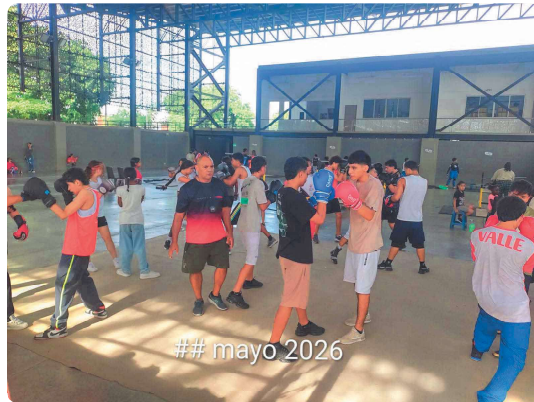
ESCUELA DE COMBATE LIBRE

Informe actividades Contrato # IND-26-1489 de 2,026.