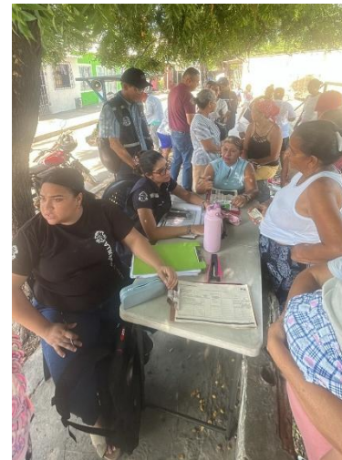
Foto 2 y 3. Evento de convocatoria para acceder al proyecto de Titulación de predios modalidad de cesión a título gratuito en el barrio Rebolo los días 12-05-26 al 15-05-2026 y 21-05-26