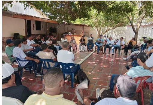
Foto 4. Reunión de seguimiento a los predios entregados para su estudio, socialización y titulación los días 8-05-2026 y 15-05-2026

Asistí a las reuniones programadas por la Oficina Hábitat para hacer seguimiento a los predios entregados para su estudio, socialización y titulación y participar en los eventos de entrega de títulos.