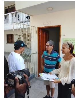
Foto 5 y 6. Apoyo logístico y acompañamiento en la entrega de títulos por parte del Alcalde de Barranquilla a beneficiarios del Barrio Juan Mina de la ciudad, el día 23-05-2026