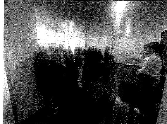
12/05/2026 Acompañamiento a inspección de policía proceso de lanzamiento de adulta mayor.