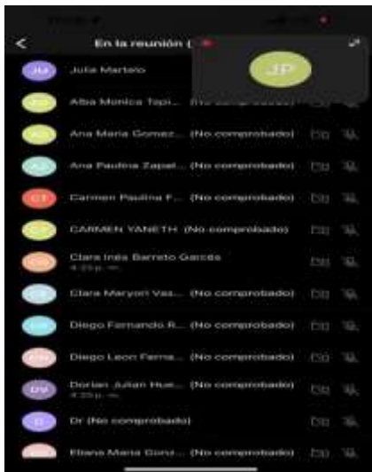
Ilustraciones: Ilustración Videoconferencia Fondo Emprender