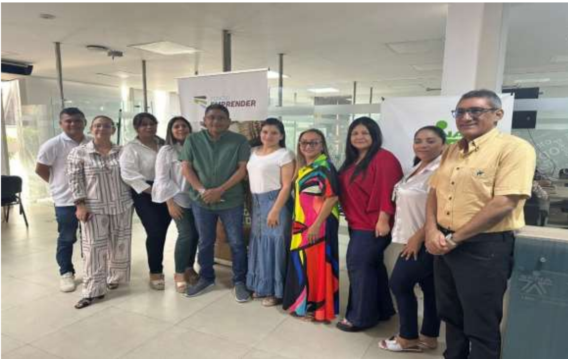
Ilustración: Reunion de Indicadores con el lider de la unidad de emprendimiento