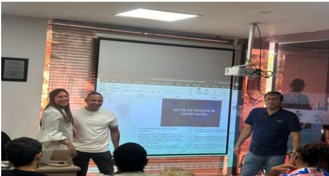
Ilustración: Contrapartida MAGYMBOO FITNESS SAS