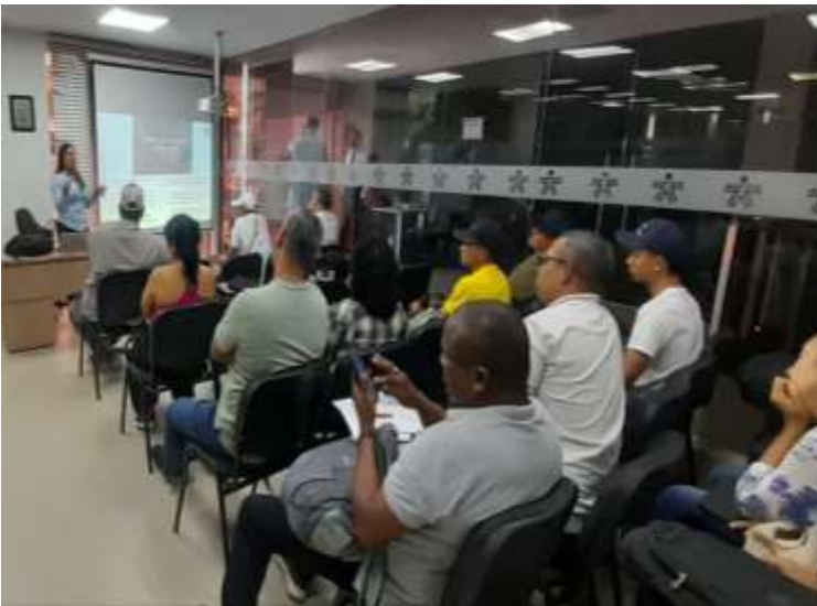
Ilustración: Iniciación de Ruta de emprendimiento -Jueves de Emprendimiento

ACTIVIDAD N°4 Evidencia correspondiente a: Formular los planes de negocio de los usuarios de su propia gestión y los que le sean asignadas por el Centro de Desarrollo Empresarial y la Regional