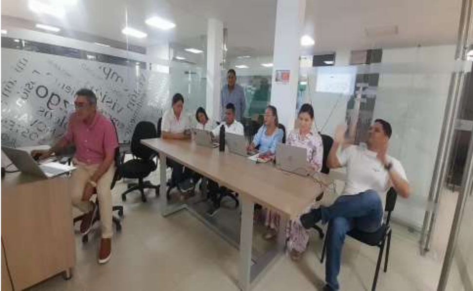
Ilustraciones: Socialización de la TRD