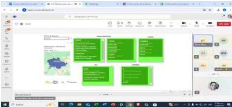
Ilustraciones: Ilustración de Plan por Plan

ACTIVIDAD N°1 Cumplir con el plan de acción formulado con base en los Lineamientos entregados por la Coordinación Nacional de Emprendimiento