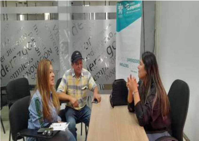
Ilustración: Atención en sala