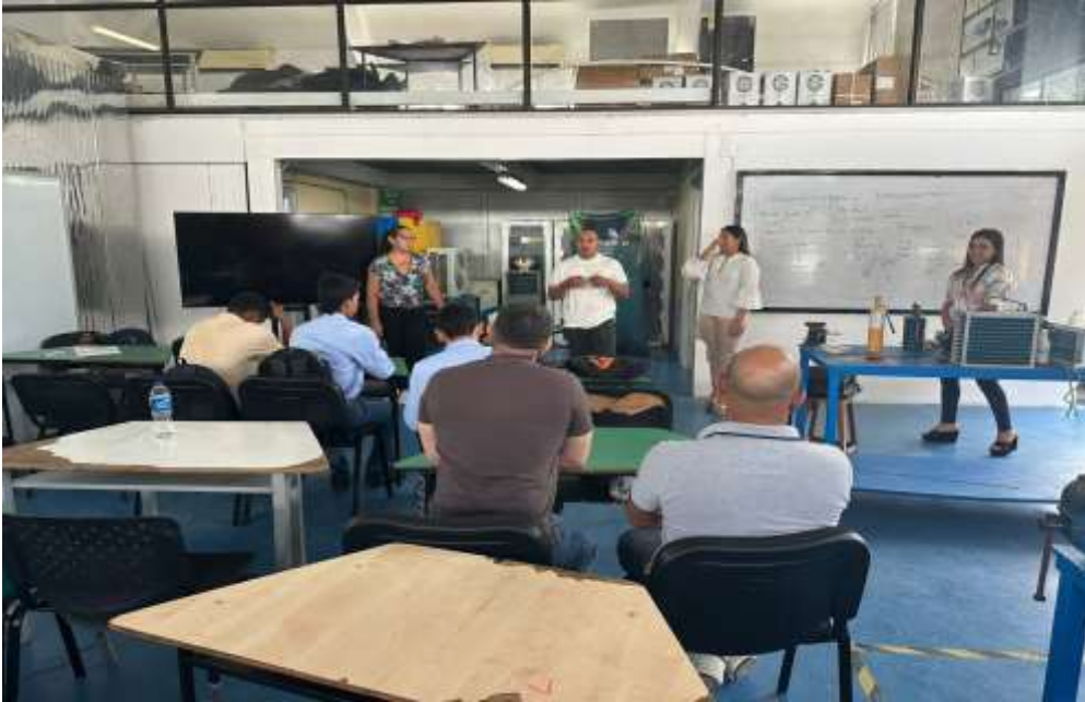
Ilustraciones: Contrapartida MAGYMBOO FITNESS SAS

ACTIVIDAD N° 5 Acompañar y orientar a los emprendedores de su propia gestión y los que le sean asignadas por el Centro de Desarrollo Empresarial y la Regional en la fase de creación de empresa