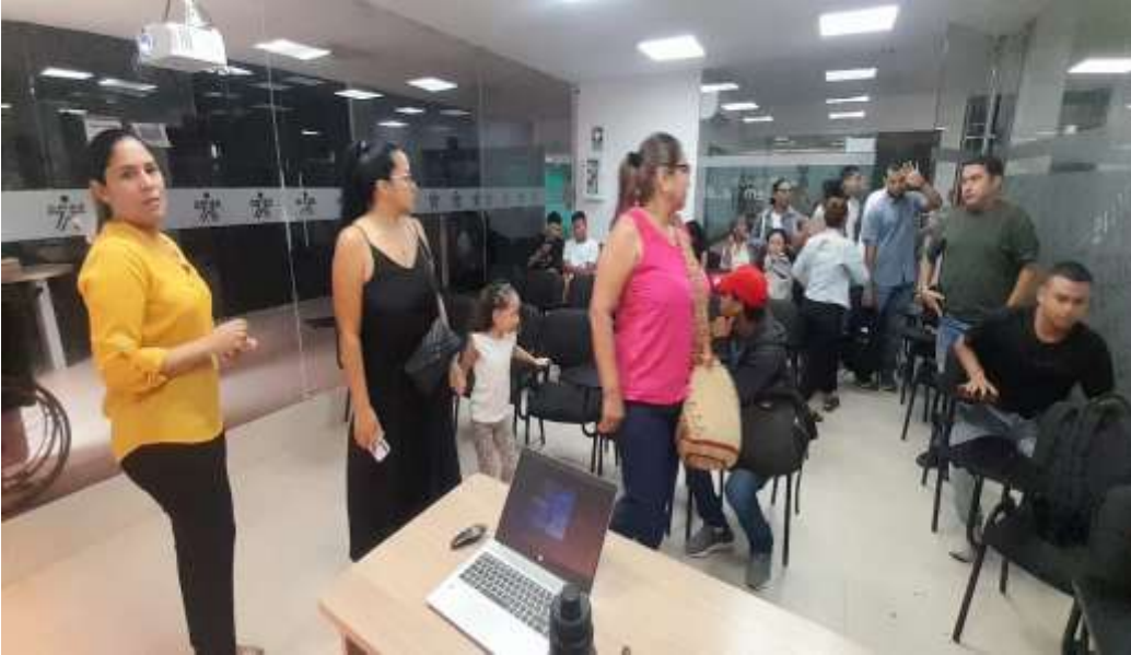
Ilustraciones: Acta de Seguimiento

ACTIVIDAD N°4 Evidencia correspondiente a: Formular los planes de negocio de los usuarios de su propia gestión y los que le sean asignadas por el Centro de Desarrollo Empresarial y la Regional