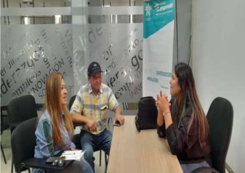
Ilustración: Atención en sala