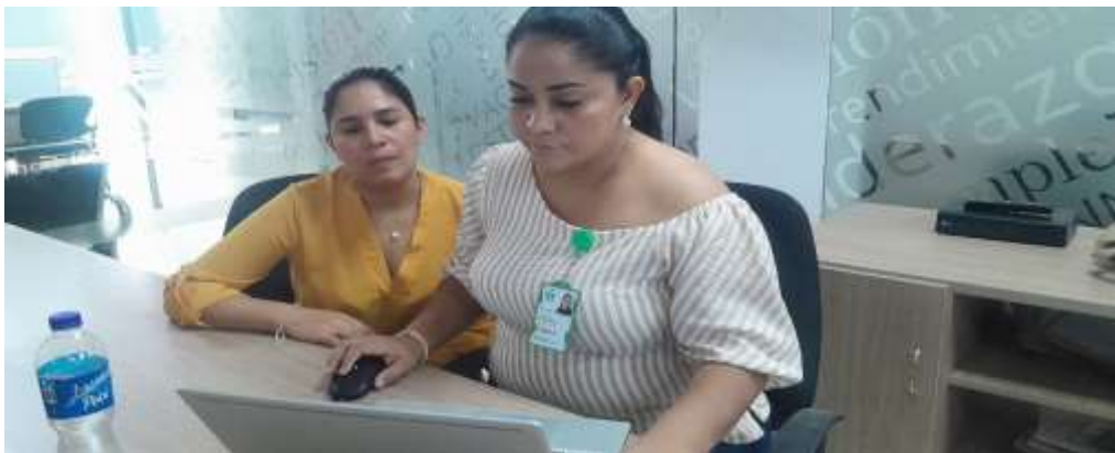
Ilustración: Socialización con el apoyo administrativo de la oficina Fondo Emprender: Procesos administrativos

ACTIVIDAD N° 15 Gestionar alianzas con actores territoriales, nacionales e internacionales que permitan el logro de los objetivos de Emprendimiento de la Regional.