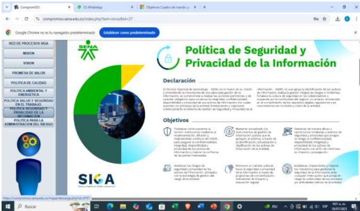
Ilustraciones: Lineamientos del Sistema Integrado de Gestión y Autocontrol (SIGA)

Versión: 01, Formato Informe previo espacios de participación de rendición de cuentas Regional o Centros de Formación.