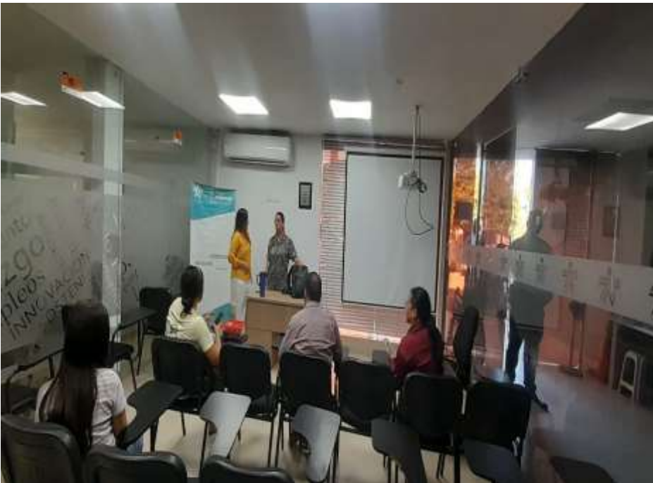
Ilustración: Taller de Ideación

ACTIVIDAD N°4 Evidencia correspondiente a: Formular los planes de negocio de los usuarios de su propia gestión y los que le sean asignadas por el Centro de Desarrollo Empresarial y la Regional