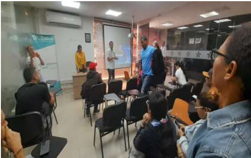
Ilustración Orientación a emprendedores

ACTIVIDAD N° 9 Programar y participar en eventos de divulgación o actividades de fomento del Centro de Desarrollo Empresarial o la regional de acuerdo con los Lineamientos de la Coordinación Nacional de Emprendimiento