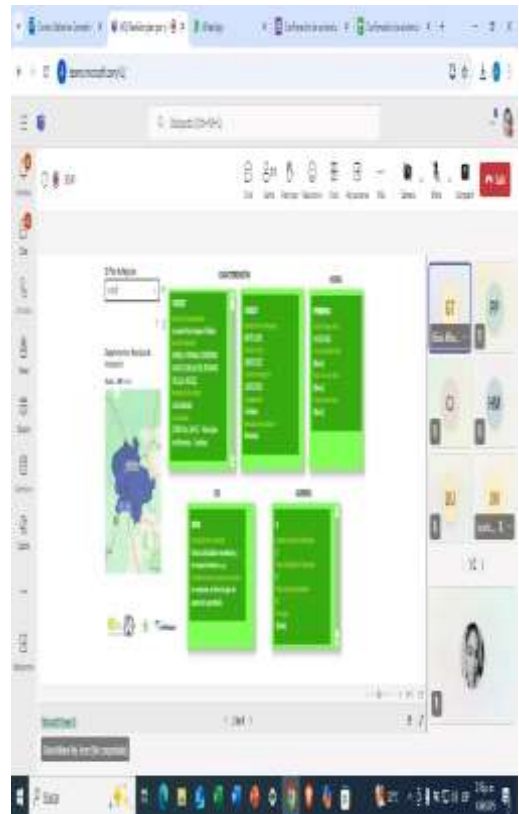
Ilustraciones: Ilustración de Plan por Plan