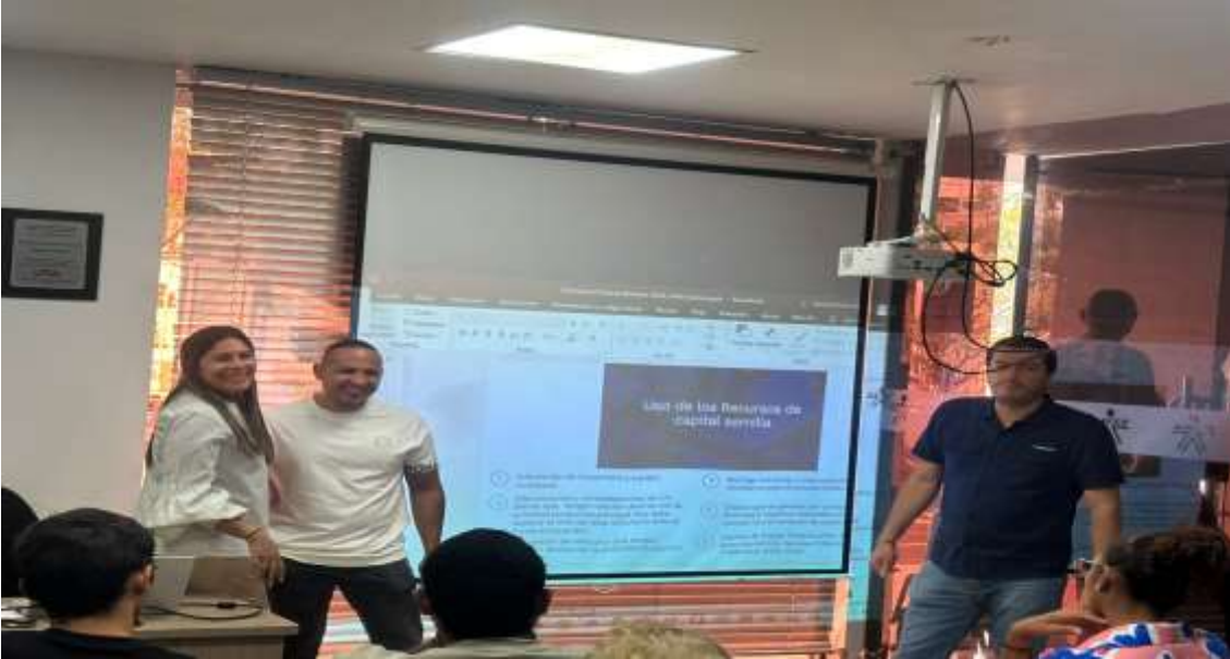
Ilustración: Contrapartida MAGYMBOO FITNESS SAS

ACTIVIDAD N°4 Evidencia correspondiente a: Formular los planes de negocio de los usuarios de su propia gestión y los que le sean asignadas por el Centro de Desarrollo Empresarial y la Regional