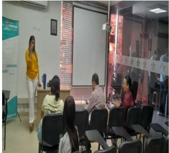
Ilustraciones: Taller de Plan de Negocio 2