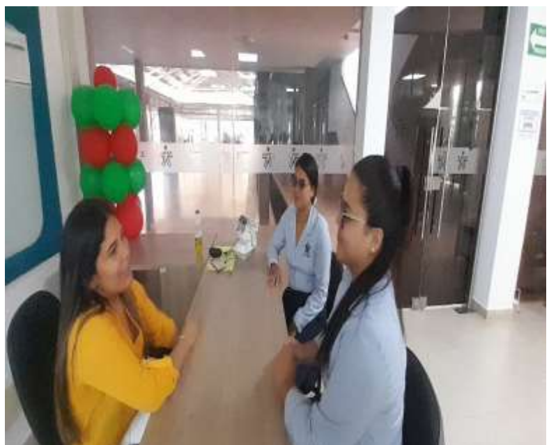
Ilustracion: Atencion en sala con aprendices