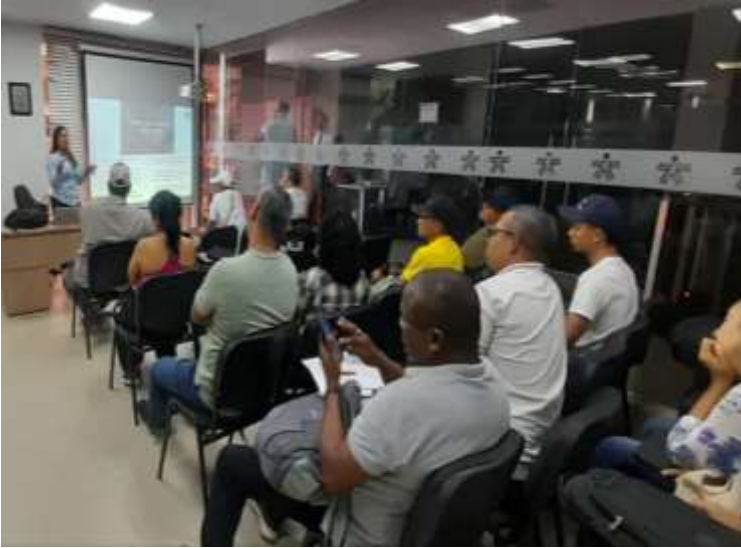
Ilustración: Iniciación de Ruta de emprendimiento -Jueves de Emprendimiento

ACTIVIDAD N° 5 Acompañar y orientar a los emprendedores de su propia gestión y los que le sean asignadas por el Centro de Desarrollo Empresarial y la Regional en la fase de creación de empresa