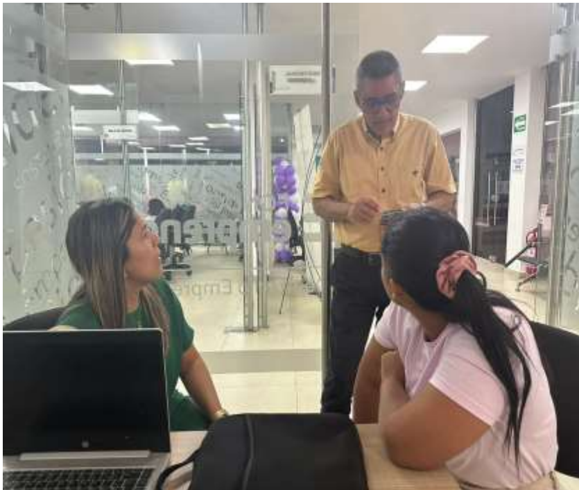
Ilustraciones: Asesoría de Plan de Mejora Convocatorias Nacionales

ACTIVIDAD N° 5 Acompañar y orientar a los emprendedores de su propia gestión y los que le sean asignadas por el Centro de Desarrollo Empresarial y la Regional en la fase de creación de empresa