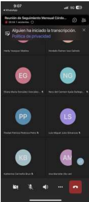
Ilustraciones: Ilustración Reunión virtual 9 de dic seguimiento

ACTIVIDAD N°1 Cumplir con el plan de acción formulado con base en los Lineamientos entregados por la Coordinación Nacional de Emprendimiento