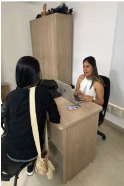
Ilustracion: Atencion en sala