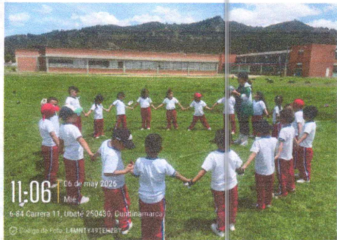
REGISTRO FOTOGRÁFICO: N° 3 LUGAR: Cancha IED Bolivar sede Unidad Básica FECHA: 06/05/2026 NOMBRE DEL EVENTO: Sesiones Diarias

La formadora desarrollo las sesiones de clase teniendo en cuenta los objetivos, aspectos físicos, técnicos y evaluativos.