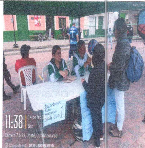
REGISTRO FOTOGRÁFICO: N° 2 LUGAR: Parque los Libertadores FECHA: 14/02/2026 NOMBRE DEL EVENTO: Convocatoria

Instituciones Educativas, Resguardos Indígenas, Personas en Situación de Discapacidad, Población Diversa y demás comunidades que se puedan beneficiar su proceso técnico y pedagógico.