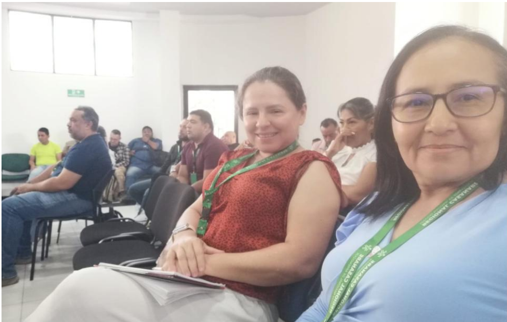
Anexo No. 3 actividad 15