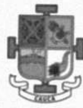
TABLA N° 3