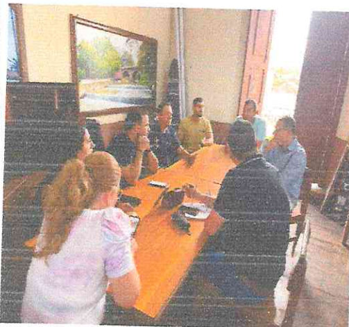
Reunión Equipo desarrollo Económico 04 de mayo del 2026 Antigua Estación del Ferrocarril