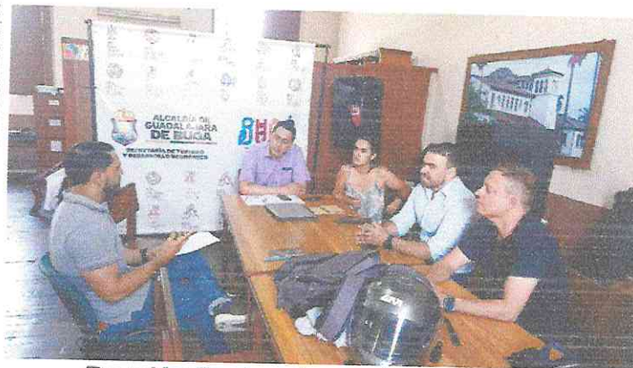
Reunión Equipo desarrollo Económico 19 de mayo del 2026 Antigua Estación del Ferrocarril