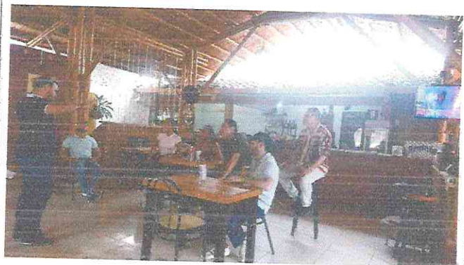
Reunión Equipo desarrollo Económico 25 de mayo del 2026 Amarena Macarena Restobar