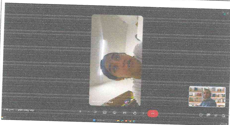
Reunión con la representante legal de DANROSSE boutique 05 de mayo del 2026 Atención virtual – Via Google meet.