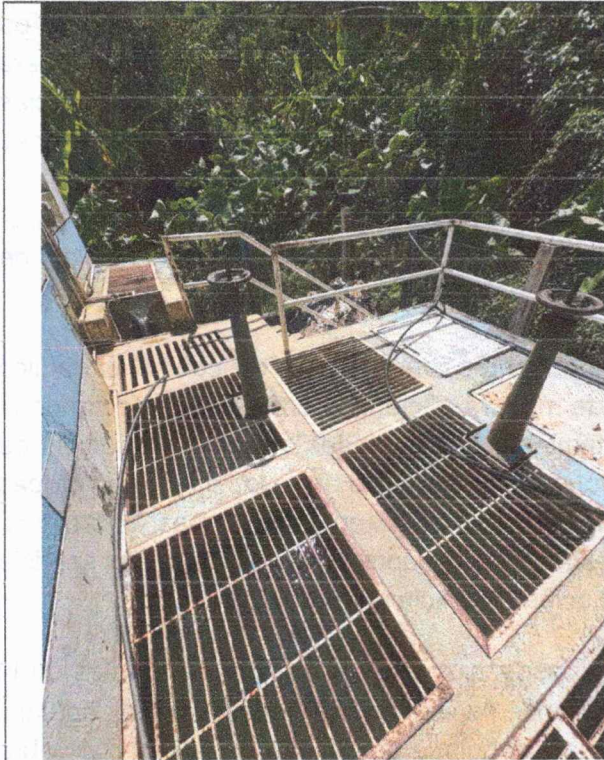
PTAP CASCO URBANO