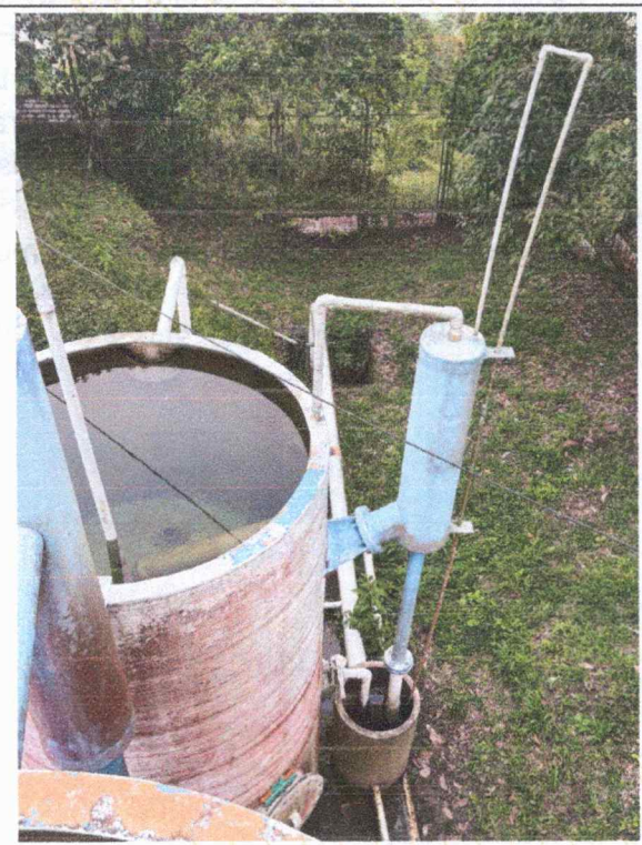
PTAP SANTA BARBARA