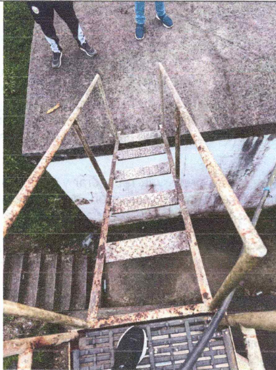
PTAP SANTA BARBARA