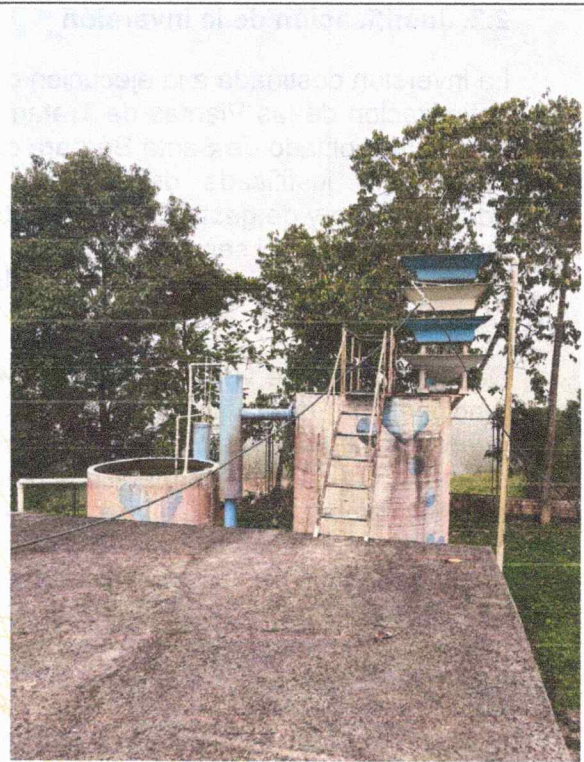
PTAP SANTA BARBARA