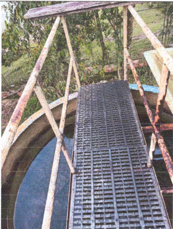
PTAP SANTA BARBARA