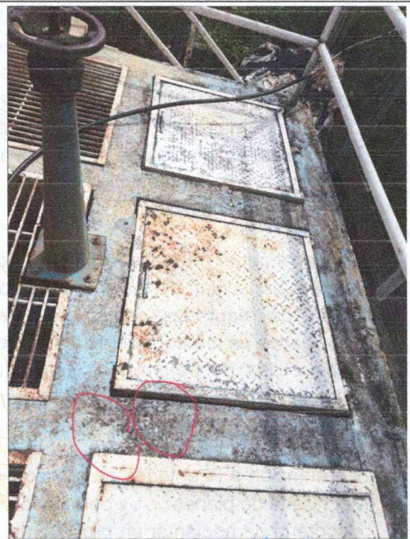
PTAP CASCO URBANO