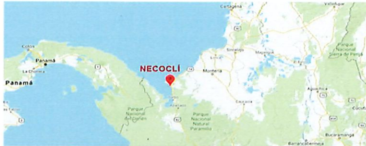
1. Imagen ubicación geográfica de Necoclí Antioquia