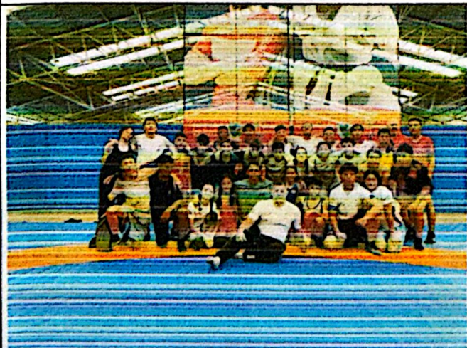
REGISTRO FOTOGRAFICO-ANEXO 5.