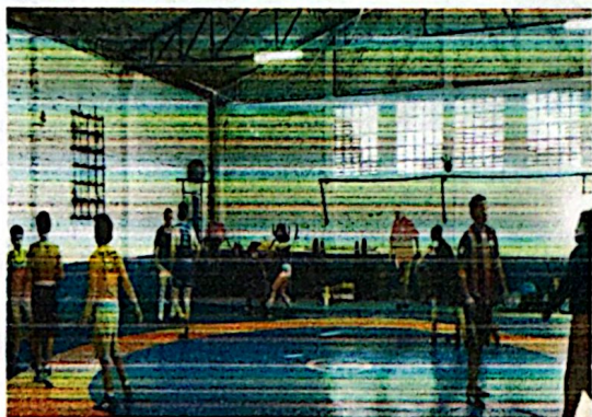
REGISTRO FOTOGRAFICO-ANEXO 3.