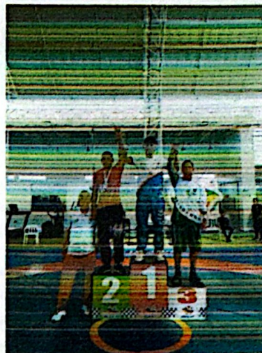
REGISTRO FOTOGRAFICO-ANEXO 5.