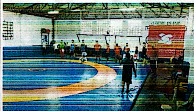
REGISTRO FOTOGRAFICO-ANEXO 3.