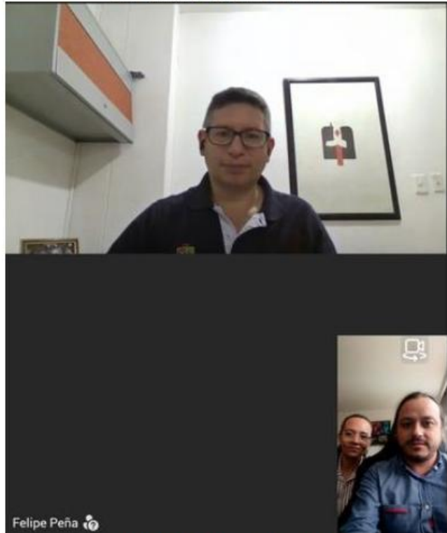
REUNION 31 03 2026

4. Apoyar en el desarrollo y participación de mesas de trabajo periódicas con los Secretarios General y de Educación, el Área Administrativa y Financiera del Sector Educativo, Área de Planeación Educativa, Área Jurídica y el Grupo de Trabajo Gestión de Calidad, para el seguimiento del avance del Estudio Técnico.