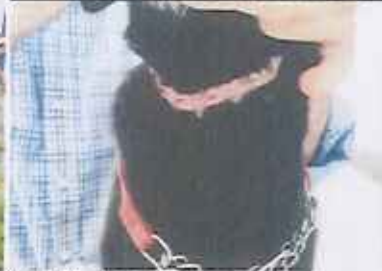
Atención de pacientes