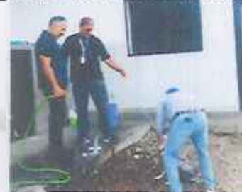
Baño medicado a pacientes

ACTIVIDAD No. 03 Diligenciar las historias clínicas derivadas de la atención de los animales que ingresen al Centro de Bienestar Animal asegurando el registro oportuno y veraz y completo, cargando cada informe y/o historia clínica en el Drive institucional correspondiente conforme e los lineamientos establecidos por la entidad.