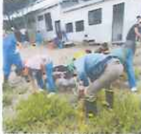
Limpieza del CBA.

Apoyo a la adopción. Recepción de casos. Tratamiento de heridas. Recuperación emocional. Manejo Clínico