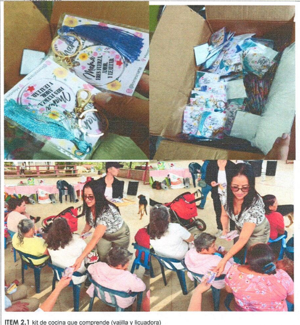
ITEM 2.1 kit de cocina que comprende (vajilla y licuadora)