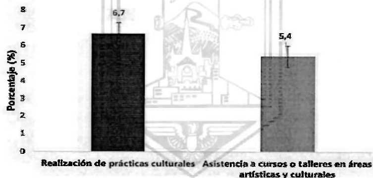
Gráfico 11. Porcentaje de personas de 12 años y más que asistieron a cursos o talleres en áreas artísticas y culturales y realizaron prácticas culturales en los últimos doce meses Cabeceras municipales 2020

El 6,7% de las personas de 12 años y más realizó prácticas culturales y el 5,4% asistió a cursos o talleres en áreas artísticas y culturales.