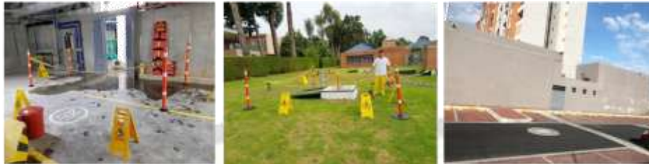
Áreas de Operación