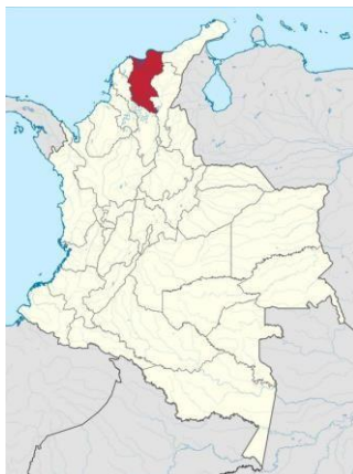
Ilustración 1: Localización general

El Magdalena es uno de los treinta y dos departamentos que, forman la República de Colombia. Su capital es Santa Marta. Está ubicado al noreste del país, en la región Caribe. Limita al norte con el mar Caribe, al este con La Guajira, al sureste con Cesar, al sur y oeste con Bolívar y al oeste con Atlántico. Fue uno de los originales nueve estados que conformaron los Estados Unidos de Colombia. El departamento toma el nombre del río Magdalena.