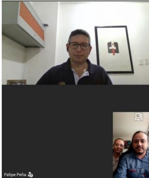
REUNION 31 03 2026

4. Apoyar en el desarrollo y participación de mesas de trabajo periódicas con los Secretarios General y de Educación, el Área Administrativa y Financiera del Sector Educativo, Área de Planeación Educativa, Área Jurídica y el Grupo de Trabajo Gestión de Calidad, para el seguimiento del avance del Estudio Técnico.