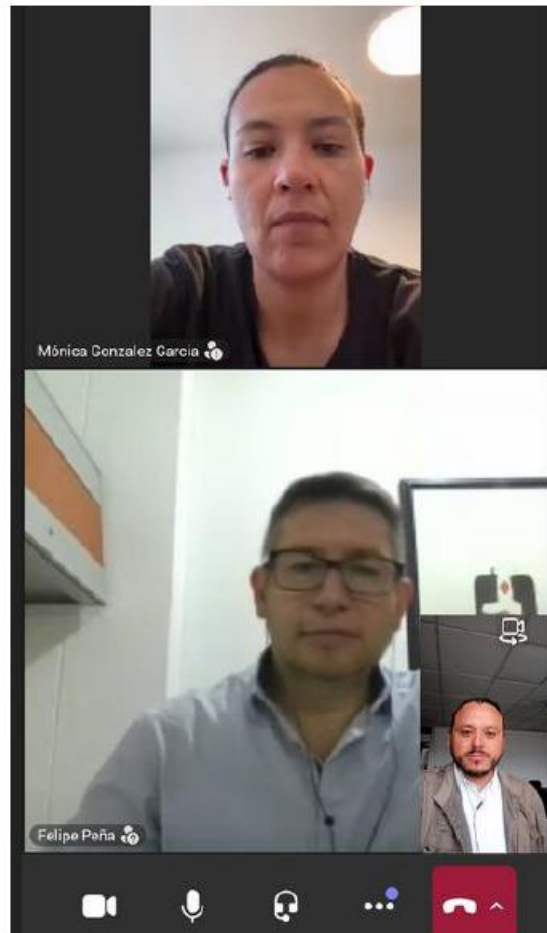
REUNION 11 03 2026

Se adelantan reuniones de seguimiento en el proceso de identificación de necesidades prioritarias de personal Contratista, perfiles requeridos y actividades a desarrollar respectivamente, para el cumplimiento de los fines esenciales de la Secretaría los días 11, 24 Y 31 de marzo