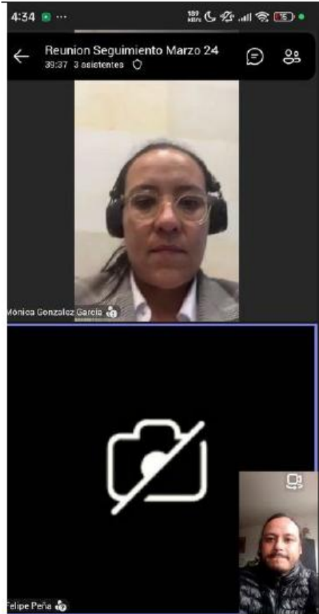
REUNION 24 03 2026