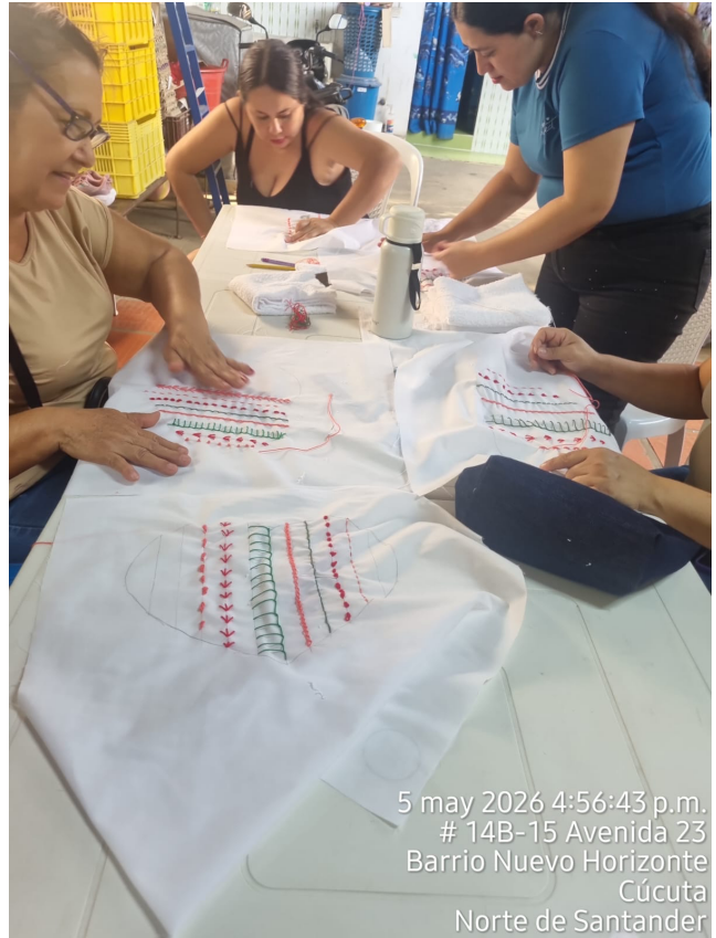
5 may 2026 4:56:43 p.m. # 14B-15 Avenida 23 Barrio Nuevo Horizonte Cúcuta Norte de Santander