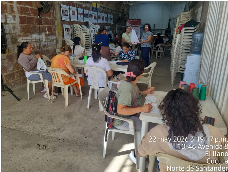
22 may 2026 3:19:17 p.m. 10-46 Avenida 8 El llano Cúcuta Norte de Santander