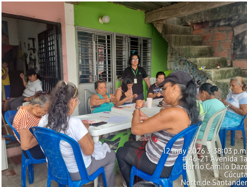
12 may 2026 3:38:03 p.m. # 46-21 Avenida 1a Barrio Camilo Dazo Cúcuta Norte de Santander