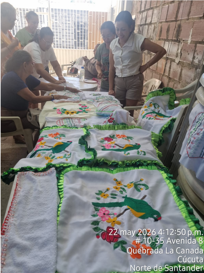
22 may 2026 4:12:50 p.m. # 10-35 Avenida 8 Quebrada La Canada Cúcuta Norte de Santander