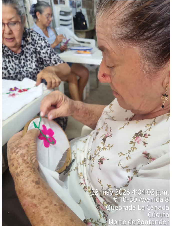
22 may 2026 4:04:02 p.m. # 10-30 Avenida 8 Quebrada La Canada Cúcuta Norte de Santander