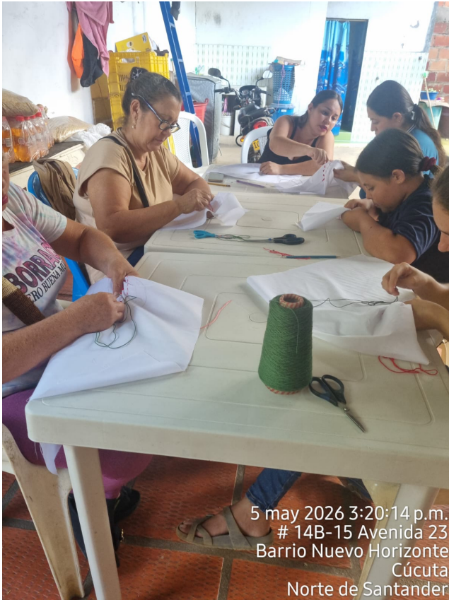
5 may 2026 3:20:14 p.m. # 14B-15 Avenida 23 Barrio Nuevo Horizonte Cúcuta Norte de Santander