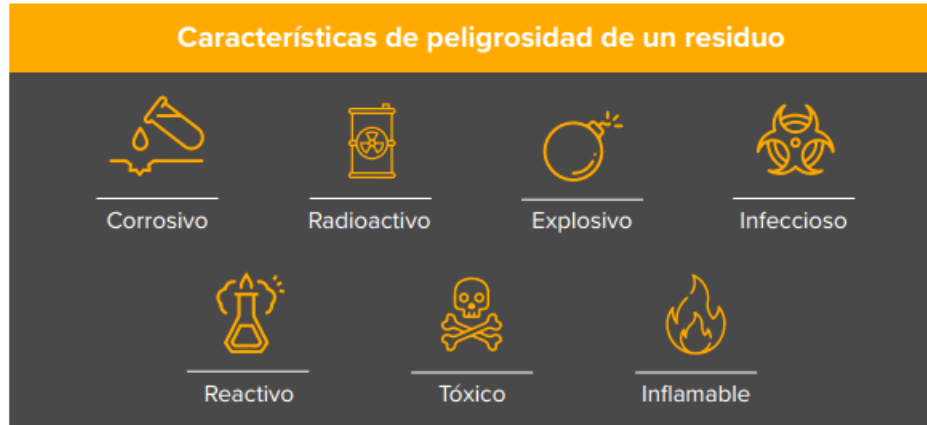
Ilustración 1: Características de los residuos peligrosos