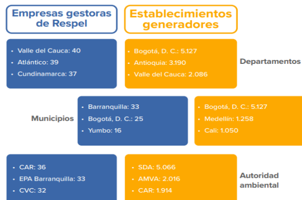
Ilustración 4: Ubicación de la cantidad de establecimientos generadores y empresas gestoras