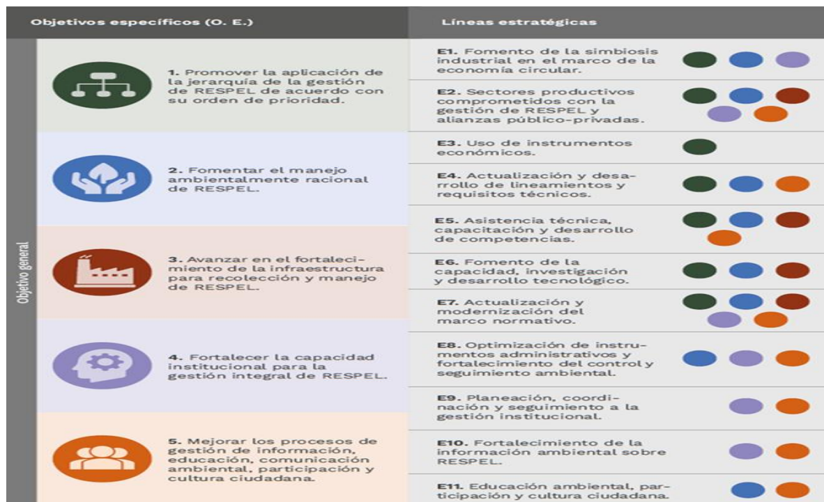
Ilustración 2: Objetivos y líneas estratégicas