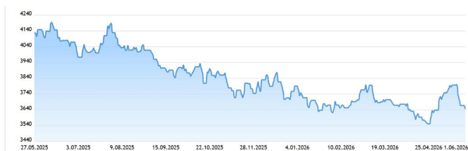
Gráfica 6: Promedio Precio Dólar 2026.

La cotización del dólar en Colombia para el día Lunes 25 de Mayo del 2026 se mantuvo inalterada. La TRM disminuyó un 11.96% (498.35 Pesos) en referencia al mismo día del año anterior, pero subió un 3.26% (115.89 Pesos) comparando con el mismo día del mes anterior.