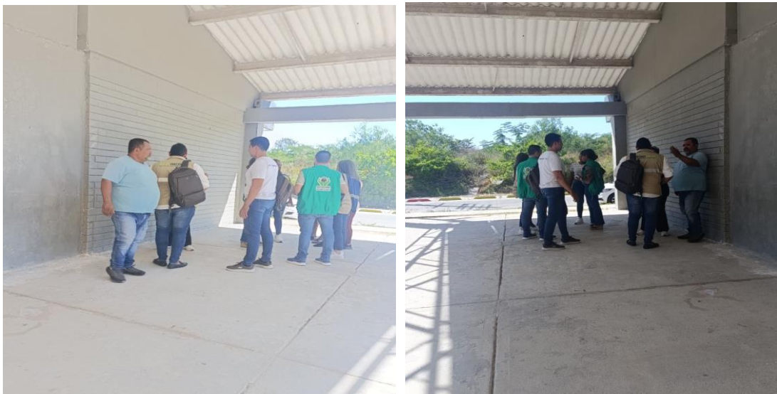
Foto de la visita realizada