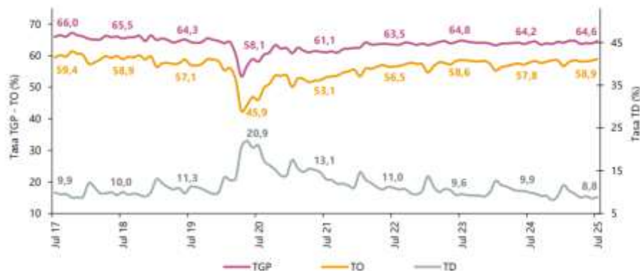
Gráfico 2. Datos expandidos con proyecciones y tasa de desocupación.

Para el mes de julio de 2025, la tasa de desocupación del total nacional fue 8,8%, lo que representó una disminución de 1,1 puntos porcentuales respecto al mismo mes de 2024 (9,9%). La tasa global de participación se ubicó en 64,6%, mientras que en julio de 2024 fue 64,2%. Finalmente, la tasa de ocupación fue 58,9%, lo que representó un aumento de 1,1 puntos porcentuales respecto al mismo mes del año anterior (57,8%).