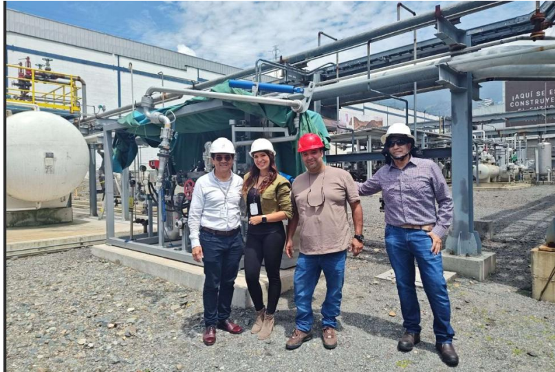
Fotos visita OPEX

Anexo 11 registro fotográfico de la visita a la empresa OPEX