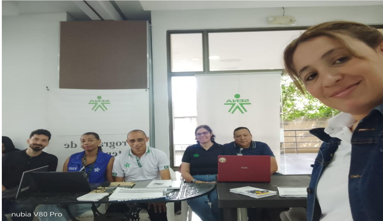
nubia V80 Pro