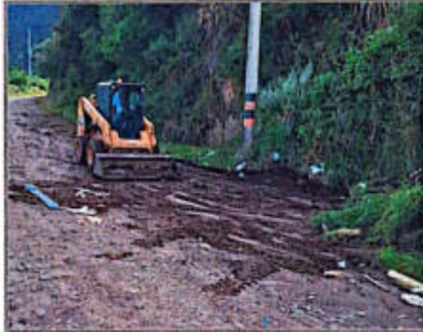
Imagen 14. Evacuación de RCD en el punto crítico