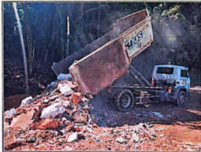
Imagen 4. Disposición final de RCD