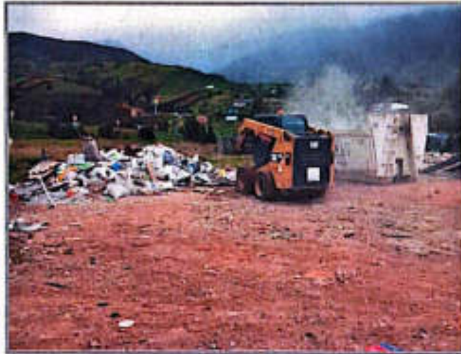
Imagen 1. Levantamiento y evacuación de RCD