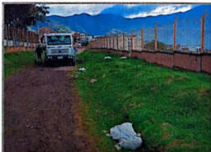
Imagen 11. Evacuación de RCD en el punto crítico

El martes 21 de abril se realizó la recolección de los RCD que se encontraban depositados de manera inadecuada en la calzada vial y zonas verdes ubicadas en el área posterior a la Alcaldía de Pasto, sede Anganoy. Para el desarrollo de esta actividad se empleó el vehículo R-1307 y herramientas manuales, logrando recuperar las condiciones de orden y limpieza del espacio público intervenido.