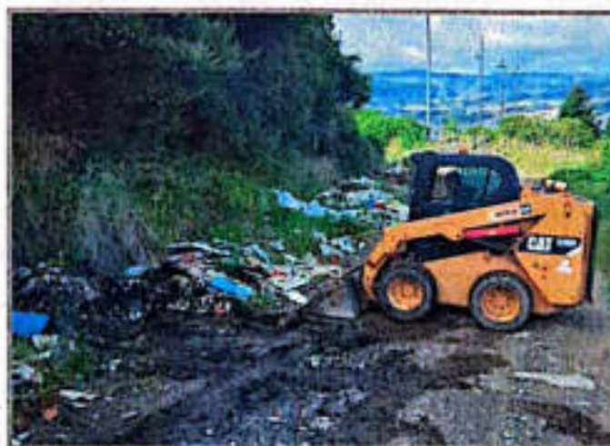
Imagen 13. Evacuación de RCD en el punto crítico

El martes 21 de abril se llevó a cabo la evacuación de los RCD que se encontraban acopiados a lo largo de la vía, situación que afectaba el tránsito vehicular y el paisaje urbano del sector. La intervención se ejecutó empleando el vehículo R-1307, el minicargador y herramientas manuales, logrando restablecer las condiciones adecuadas de movilidad y el mejoramiento visual del entorno intervenido.