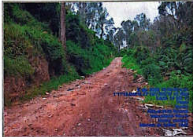
Imagen 10. Punto crítico evacuado