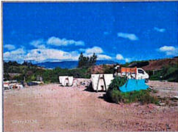
Imagen 2. Acopio de RCD en las tolvas estacionarias