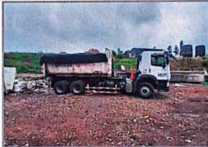
Imagen 7. Cubrimiento de la carga con geotextil