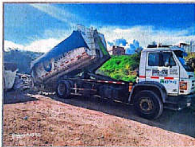
Imagen 3. Intercambio y transporte de tolvas estacionarias