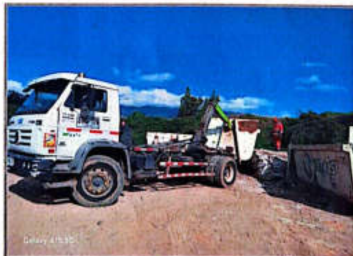
Imagen 5. Instalación de tolvas estacionarias

El punto de transferencia de RCD cuenta con cuatro tolvas estacionarias, las cuales son reemplazadas por vehículos tipo ampliroll una vez alcanzan su capacidad máxima.