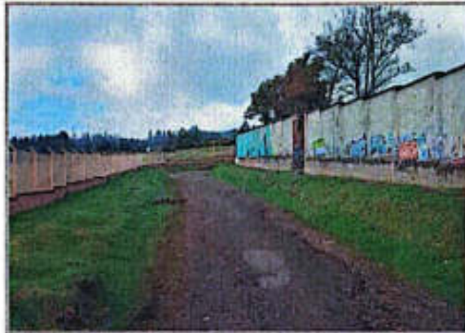
Imagen 12. Evacuación de RCD en el punto crítico