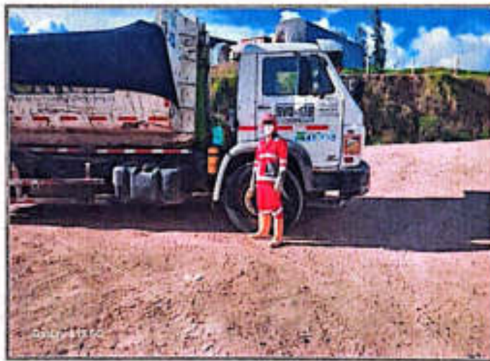
Imagen 6. Vigía ambiental

El vigía ambiental, quien trabaja durante el horario de atención al público, es responsable de asegurar la distribución uniforme de los materiales en las tolvas estacionarias del punto de transferencia de RCD.