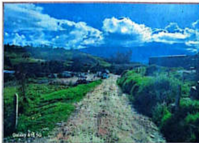
Imagen 8. Punto de transferencia de RCD

Se mantuvo una supervisión permanente en el punto de transferencia de RCD, donde el compromiso del equipo operativo ha permitido brindar un servicio de alta calidad.