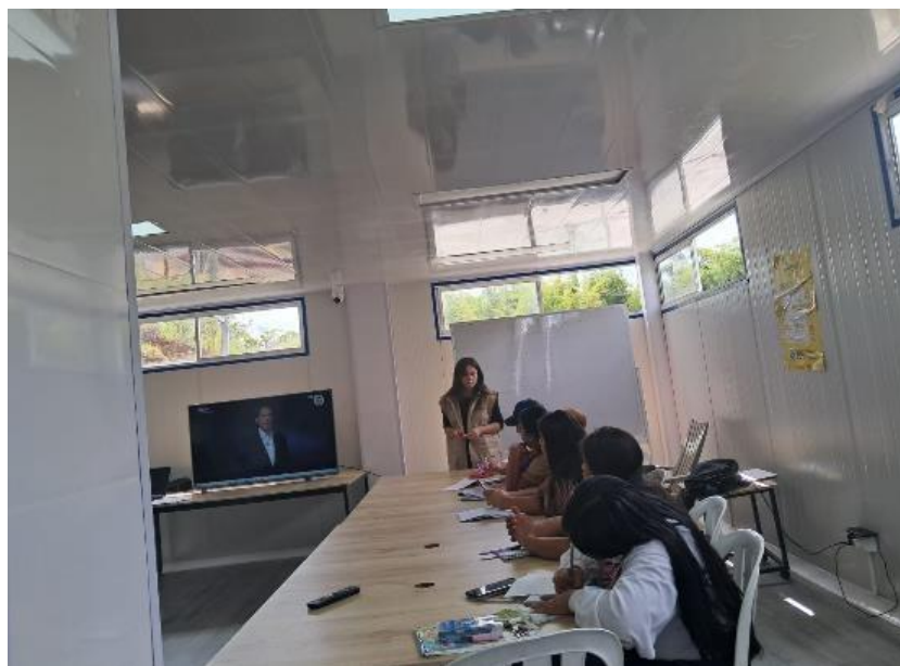
Ilustración 1 ficha 3518634 DISEÑO DE ESTRATEGIAS DE PROMOCION DIGITAL PARA EMPRENDIMIENTOS, clase presencial. En estas fotografías observamos a los aprendices del municipio del Tambo, departamento del Cauca. Se explican temas de plataformas digitales, se dan ejemplos y el paso a paso de como realizar el diseño de promoción según la plataforma que escoge el aprendiz para visualizar y vender sus productos.