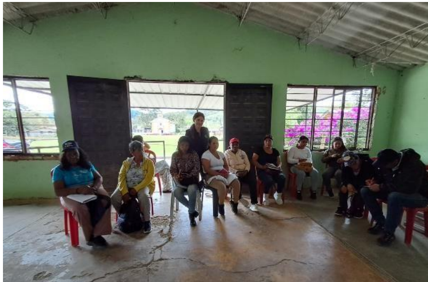
Ilustración 1 ficha 3509439 FORMACIÓN MARKETING DIGITAL, clase presencial. En estas fotografías observamos a los aprendices del municipio del Tambo, corregimiento las botas 2, departamento del Cauca. Se socializa con el grupo temas de introducción, conceptos e impacto digital en las ventas, en la foto podemos evidenciar actividad de integración y presentación por cada uno de los aprendices de su emprendimiento y canales que utiliza para su comercialización.