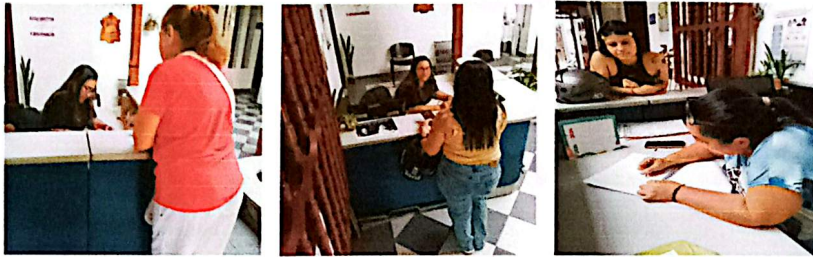
Imagen de la base de datos de personas atendidas debidamente actualizada.