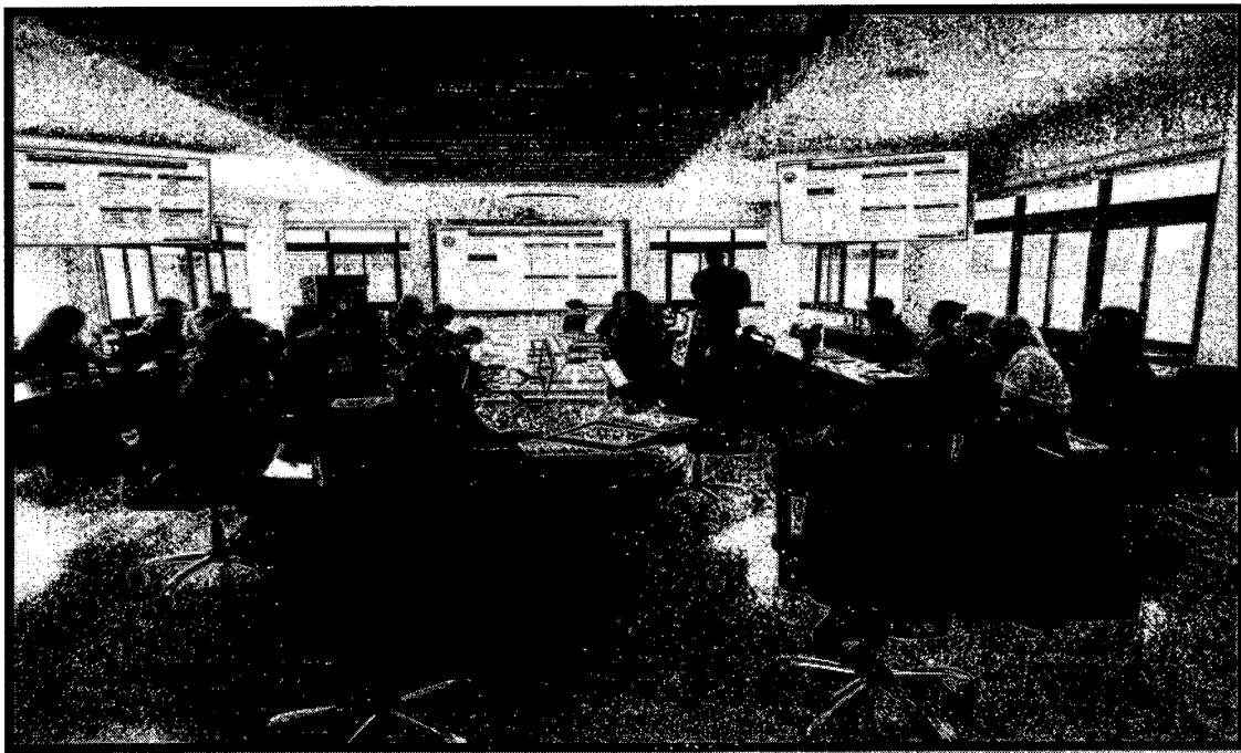
Reunión evaluación docente

Presentación I Comité autoevaluación 2026