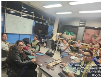
mié, 20 may Bogotá

20 may 2026 21:09:20 #17B-25S Carrera 30 Antonio Nariño Bogotá