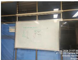
✓ jue, 21 may Bogotá

21 may 2026 21:57:30 #17B-25S Carrera 30 Antonio Nariño Bogotá