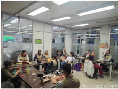
mar, 19 may Bogotá

14 may 2026 21:27:37 #17B-25S Carrera 30 Antonio Nariño Bogotá