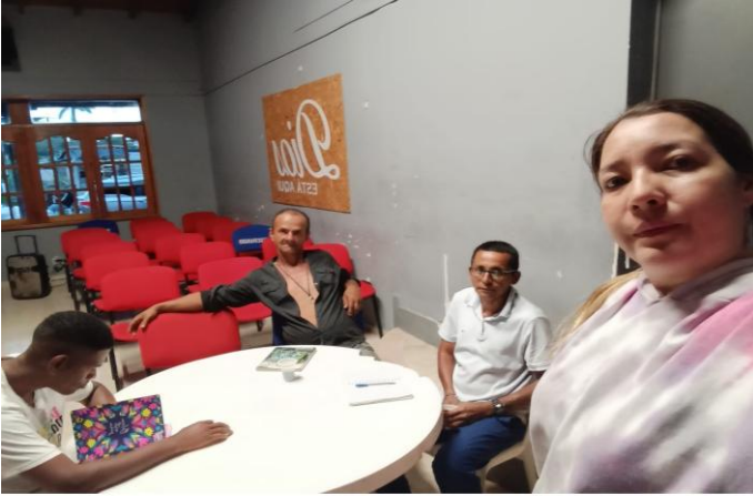
OPPO A5 Pro 5G 1 de junio de 2026, 6:07 p. m. Dosquebradas