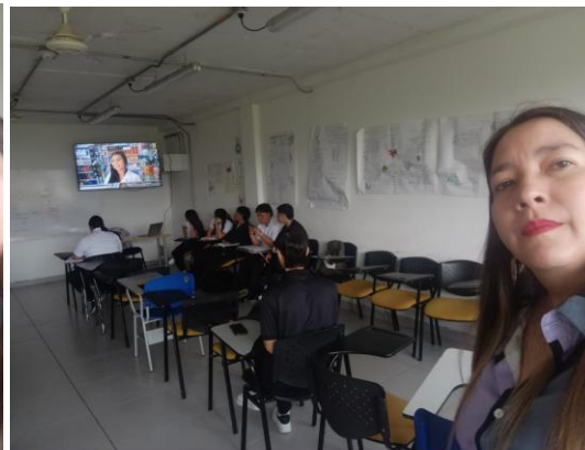
OPPO A5 Pro 5G 4 de junio de 2026, 8:13 a. m. Pereira