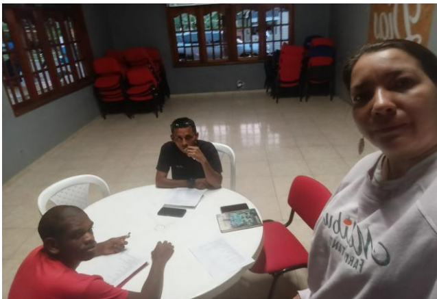
OPPO A5 Pro 5G 11 de junio de 2026, 6:13 p. m. - Dosquebradas