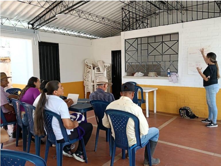
OPPO A5 Pro 5G 16 de junio 2026, 9:21 a. m. Pereira