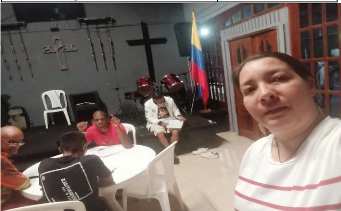
OPPO A5 Pro 5G 4 de junio de 2026, 6:26 p. m. Dosquebradas