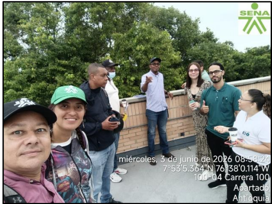
miércoles, 3 de junio de 2026 08:56:24 7°53'5.364"N 76°38'0.114" W 100-04 Carrera 100 Apartadó, Antioquia