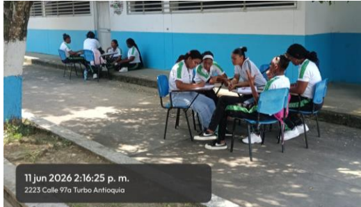
11 jun 2026 2:16:25 p. m. 2223 Calle 97a Turbo Antioquia