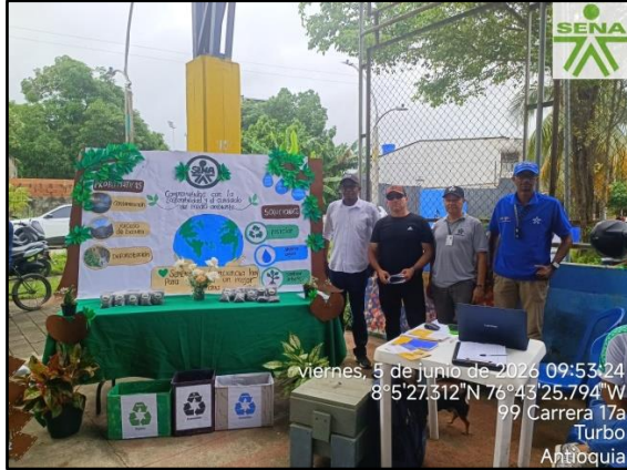
viernes, 5 de junio de 2026 09:53:24 8°5'27.312"N 76°43'25.794" W 99 Carrera 17a Turbo Antioquia