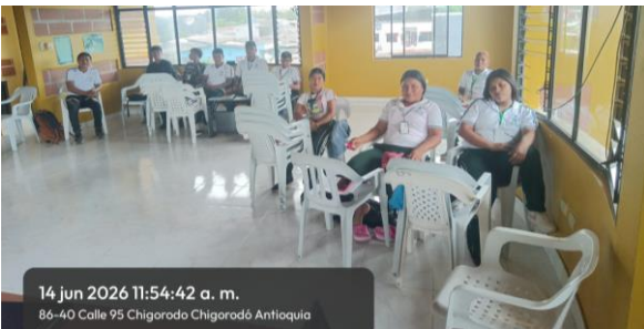
14 jun 2026 11:54:42 a. m. 86-40 Calle 95 Chigorodó Chigorodó Antioquia