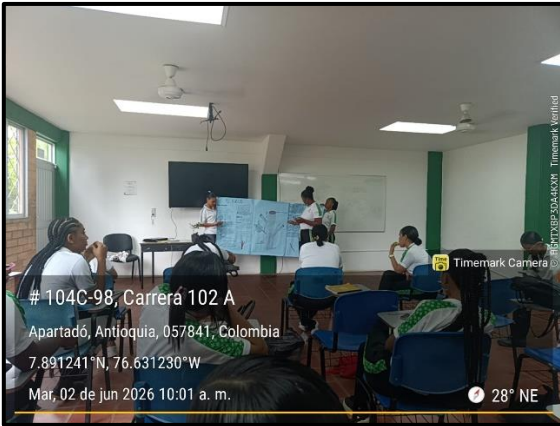
#104C-98, Carrera 102 A Apartadó, Antioquia, 057841, Colombia 7.891241°N, 76.631230°W Mar, 02 de jun 2026 10:01 a. m.