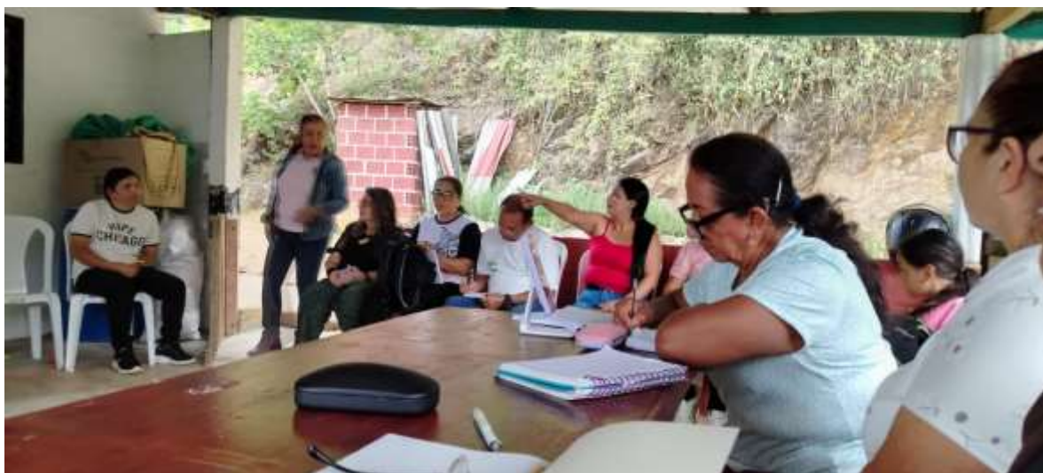
Mayo 26/2026 hora 2.44 pm