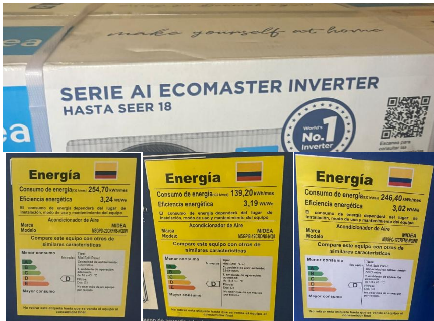
Ilustración 3. Características energéticas equipos recibidos.