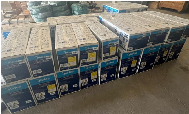
Ilustración 2. Aires recibidos

Como prueba de recepción a satisfacción de los bienes/obras/servicios contratados el supervisor de conformidad con los artículos 83 “Supervisión Contractual” y 84 “Facultades y Deberes de los Supervisores y los Interventores” de la Ley 1474 de julio 12 de 2011 que ordena el seguimiento técnico, administrativo, financiero, contable, y jurídico, sobre el cumplimiento del objeto del contrato se relaciona la siguiente información y soportes: