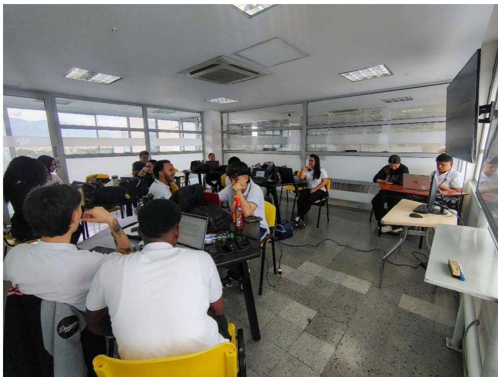
4. Ejecutando Formación