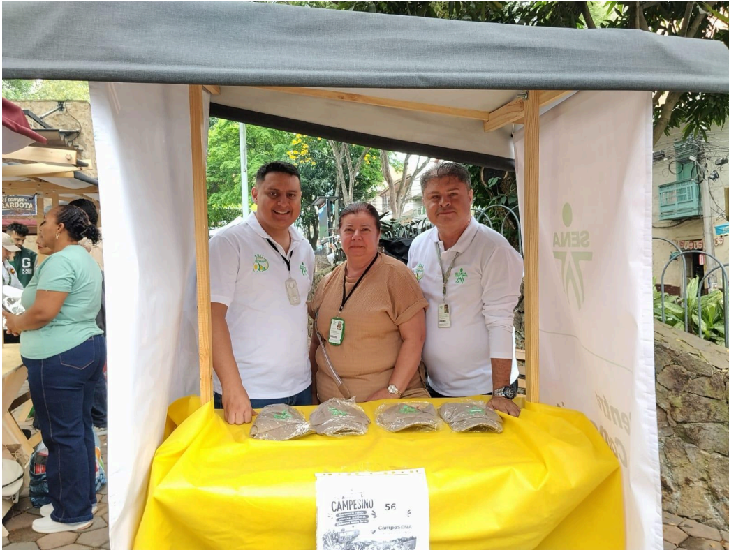
Evidencia Actividad OBLIGACIÓN 14: Día del Campesino – Municipio de Girardota Control de Cambios