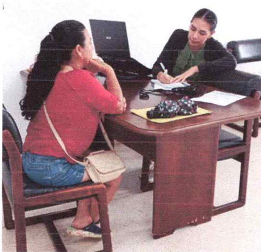
REGISTRO FOTOGRAFICO 6: