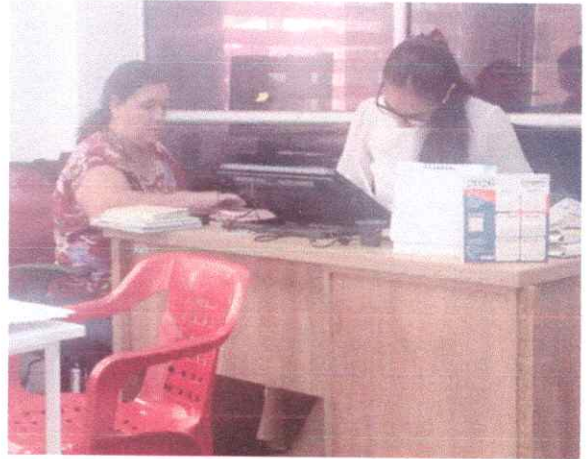
REGISTRO FOTOGRAFICO 5: