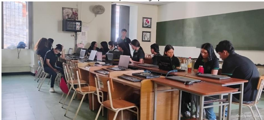
Ilustración 5. Aprendices grupo 3413794