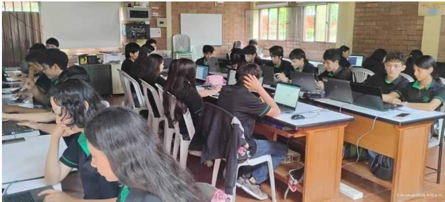
Ilustración 3. Aprendices grupo 3146285

Evidencia 3 – Obligación 4. Ejecutar la formación profesional integral de acuerdo con el currículo, desarrollo curricular y proyecto formativo de los programas del área temática objeto del contrato.