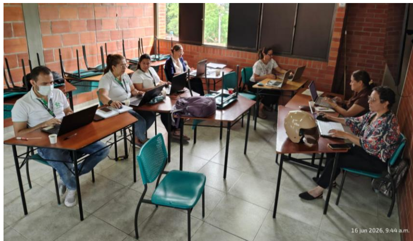
Ilustración 2 Formación complementaria Evaluación del Aprendizaje en la FPI

Evidencia 2 – Obligación 2. Participar cuando el centro de formación lo requiera, en jornadas de diseño y desarrollo curricular de programas de Formación Profesional Integral, conforme a las necesidades nacionales y a los lineamientos institucionales requeridos para el área temática objeto del contrato.