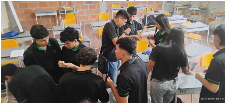
Ilustración 4. Aprendices grupo 3414180