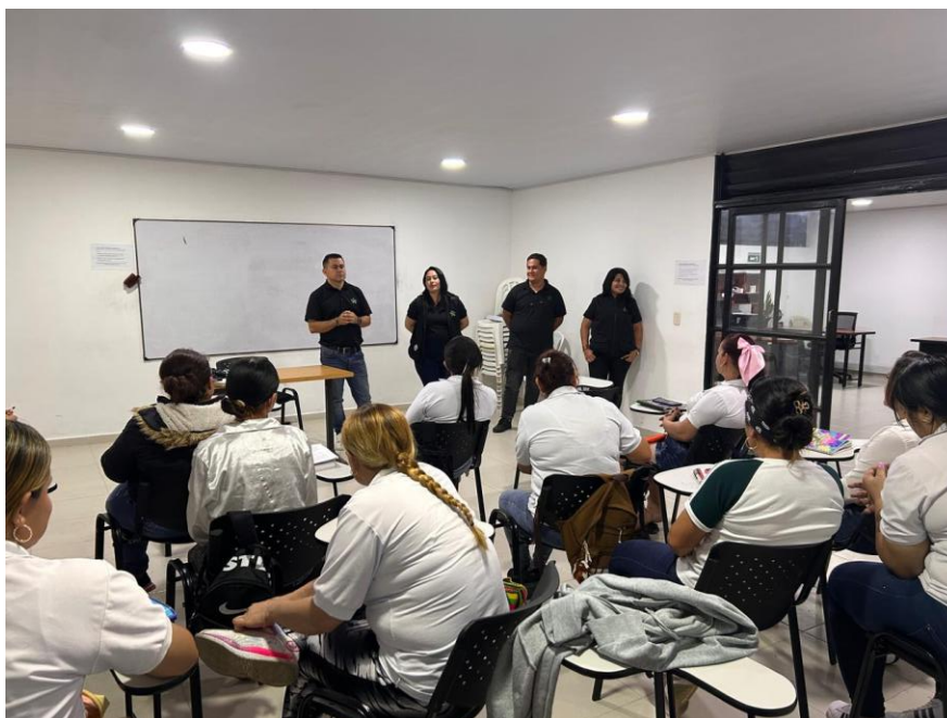
Ilustración 3. Visita a formaciones del municipio de Ocaña .