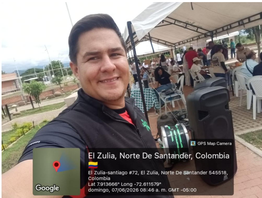
Ilustración 6. Apoyo en la organización evento en Zajuna SENA sede el Zulia.

10. OBLIGACIÓN: Coadyuvar en la logística de ejecución del desarrollo del Plan de Bienestar del Centro de Formación.