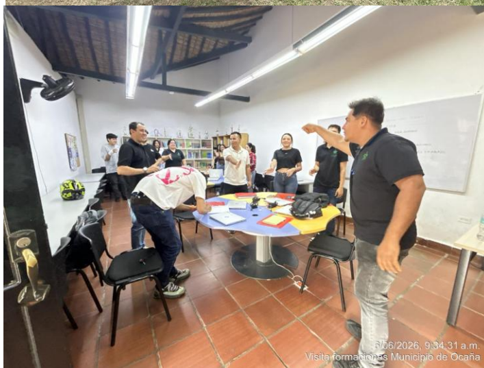
Ilustración 2. Actividad con las formaciones de ocaña.