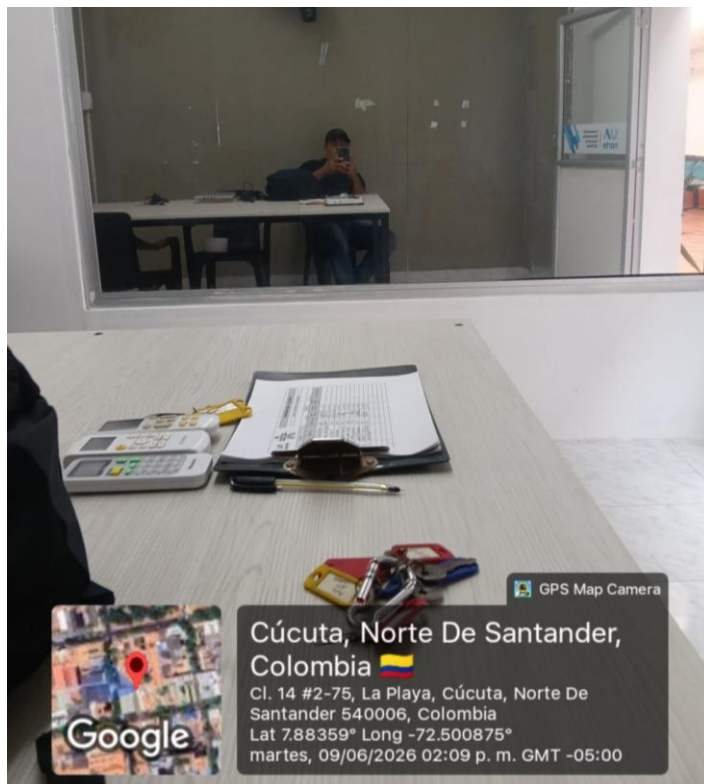
Ilustración 4. Acompañamiento y Orientación en oficina de bienestar sede UA NORTE.

6. OBLIGACIÓN: Brindar atención y orientación a los aprendices que lo requieran, en cuanto al desarrollo de los programas de bienestar al aprendiz.