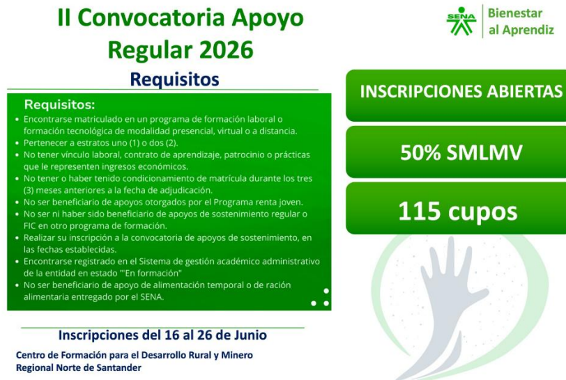
Ilustración 27. Difusión II convocatoria de apoyo regular.

Implementar acciones de bienestar al aprendiz dirigidas a los beneficiarios de apoyo para promover el uso adecuado de los beneficios, así como su propósito en la permanencia y certificación del aprendiz. Realizar registro de actividades realizadas en el aplicativo de Sofía Plus y en las demás plataformas dispuestas; realizar informes, reportes y otros documentos asociados a las actividades relacionadas con el objeto contractual, haciendo uso de las plataformas institucionales de acuerdo con el aplicativo Compromiso.