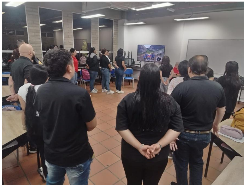
Ilustración 10. Actividad lúdico- pedagógica con formación asignada.