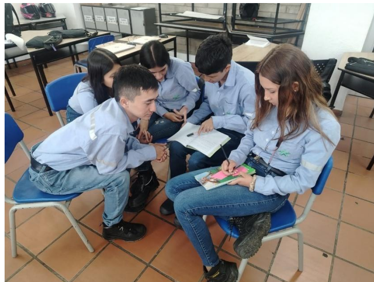
Ilustración 24. Actividad lúdico-pedagógica.