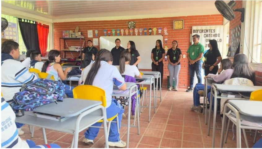
Ilustración 11. Actividad lúdico- pedagógica con formación en Ocaña.