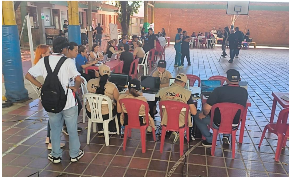
Ilustración 26. Actividad lúdico-pedagógica.