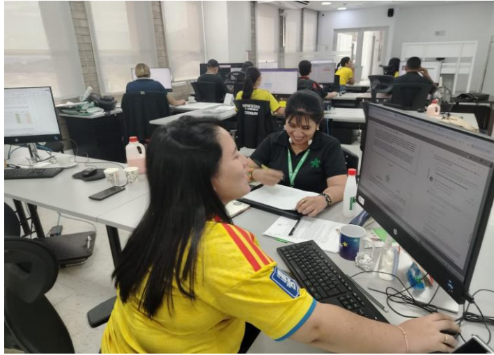
Ilustración 1 Planeación y programación de actividades de Liderazgo.

Elaborar y presentar para aprobación del Supervisor del Contrato un Plan de Trabajo que contemple el cronograma mensual de actividades y entregables, el cual servirá como instrumento de seguimiento durante la ejecución contractual y como criterio de verificación del cumplimiento para su evaluación en los informes mensuales y en el informe final de supervisión.