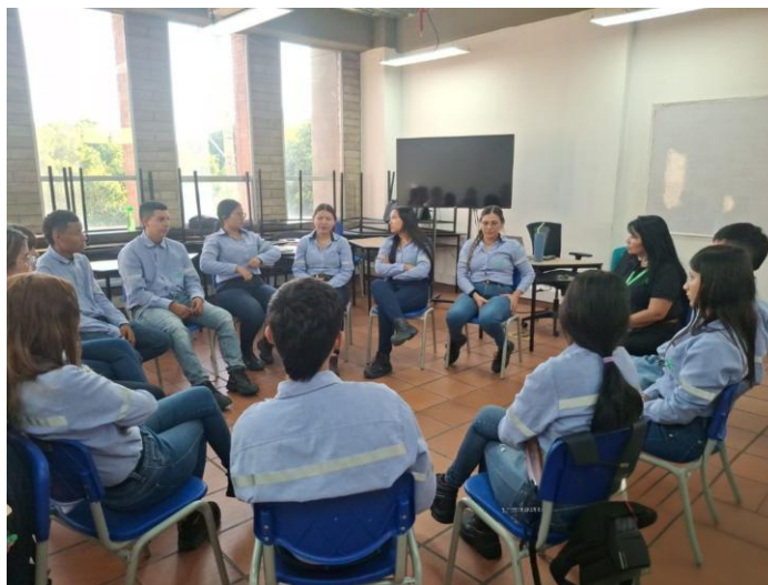
Ilustración 2. Acompañamiento a formación asignada Pescadero.

Implementar acciones necesarias para la ejecución del PNIBA con aprendices de los programas asociados a economía popular y CampeSENA, garantizando una estrategia de atención diferencial, integral e incluyente que permita el fortalecimiento de la asociatividad, organización, participación y reconocimiento social.