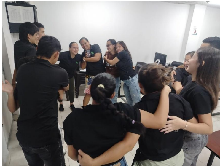
Ilustración 23. Actividad lúdico-pedagógica.

Identificar factores de riesgo de enfermedades mentales con mayor incidencia en los aprendices y adelantar acciones articuladas para la prevención de los riesgos identificados, estableciendo rutas de atención psicosocial para remitir casos críticos. Y las demás que se requieran en articulación con la Dirección de Formación Profesional para el cumplimiento del objeto contractual.