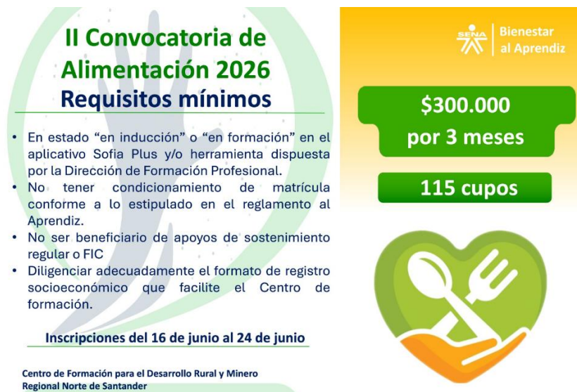
Ilustración 28. Difusión II convocatoria de monitorias de alimentación.