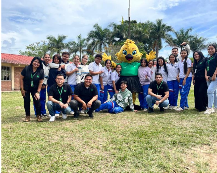
Ilustración 5. Acompañamiento a formación asignada Ocaña.