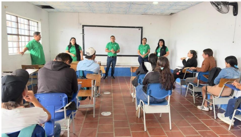
Ilustración 12. Actividad lúdico- pedagógica con formación asignada.