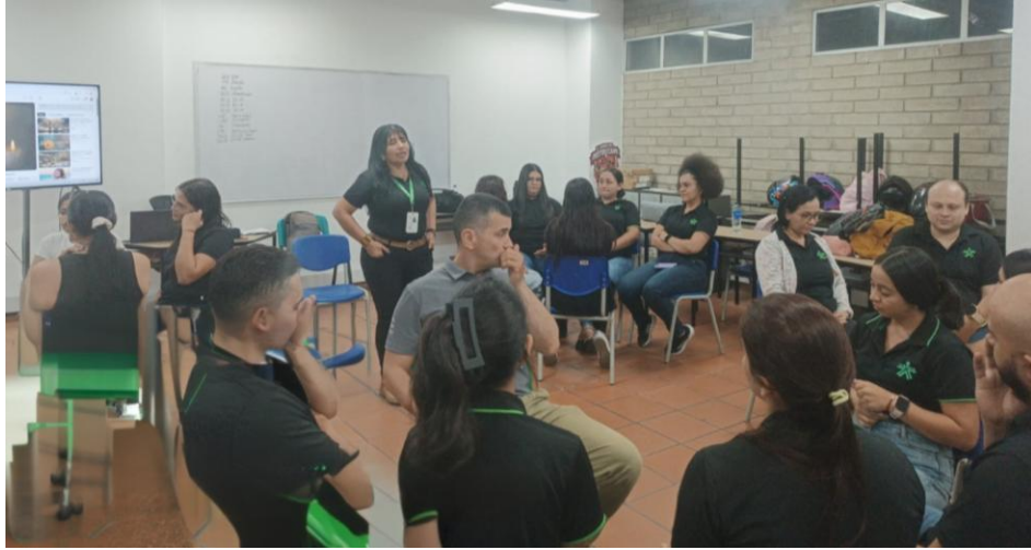
Ilustración 25. Actividad lúdico-pedagógica.