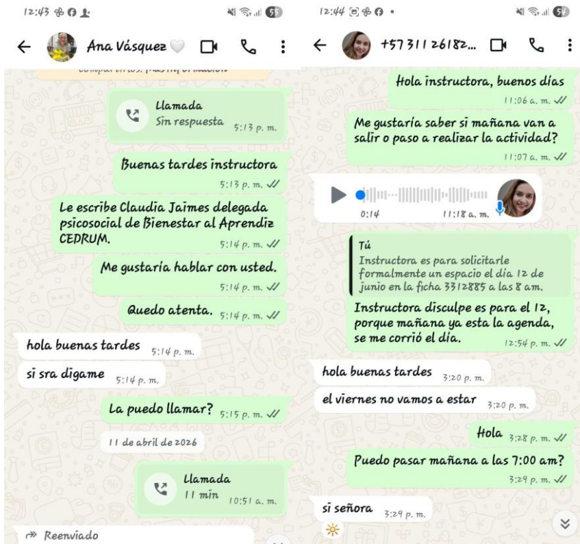
Ilustración 30. Contacto con Instructores líderes para articular.

Generar estrategias de divulgación permanentes de las actividades a desarrollar, dentro de su objeto contractual.