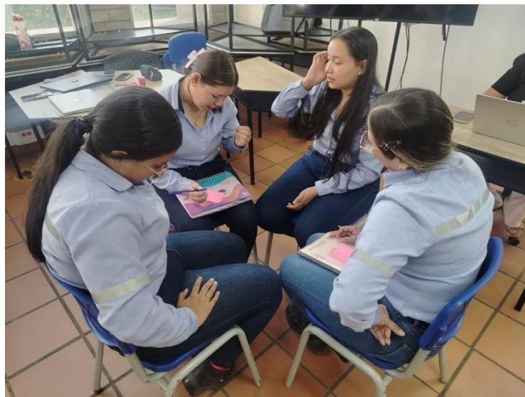
Ilustración 8. Actividad lúdico- pedagógica con formación asignada.

Realizar acompañamiento a los aprendices de los programas asociados a ECONOMIA POPULAR y CampeSENA mediante talleres, foros, conversatorios y toda actividad lúdico-pedagógica enfocada a fortalecer la asociatividad, participación, comunicación asertiva, trabajo en equipo, liderazgo, derechos humanos, cultura ambiental y organización comunitaria.