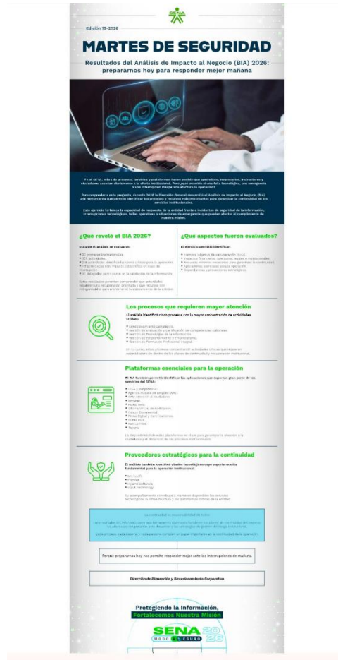
Ilustración 31. Actividad áreas seguras.

Cumplir con las normas, reglamentos e instrucciones del Sistema de Gestión en Seguridad y Salud en el Trabajo SG-SST.