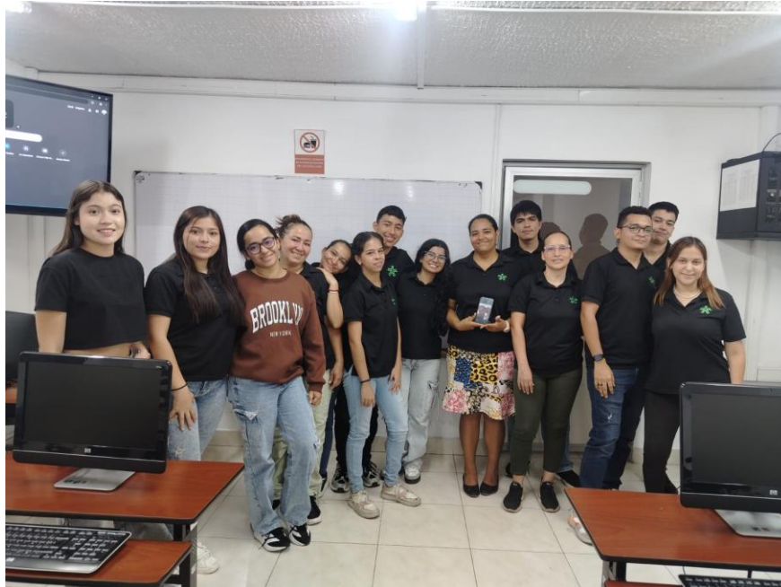
Ilustración 3. Acompañamiento a formación asignada UANORTE.