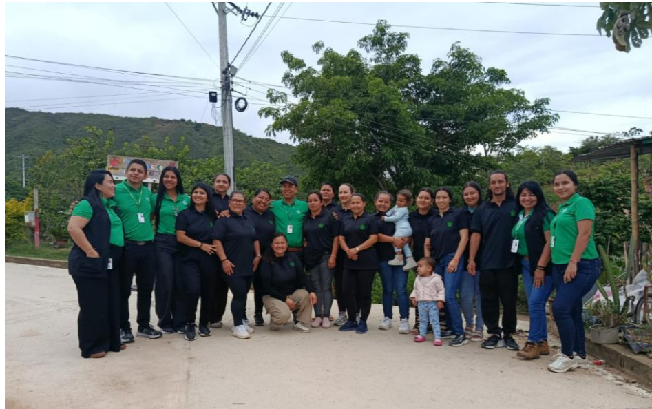
Ilustración 7. Acompañamiento a formación asignada Ocaña.