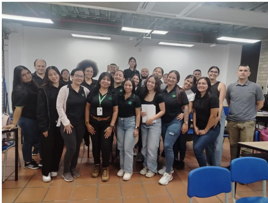
Ilustración 4. Acompañamiento a formación asignada PESCADERO.