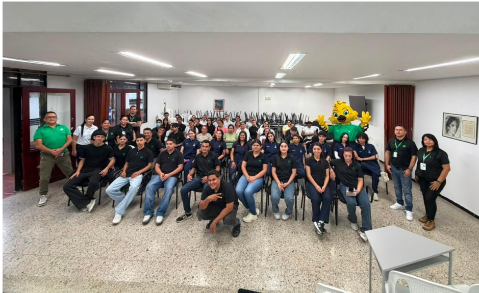
Ilustración 6. Acompañamiento a formación asignada Ocaña.