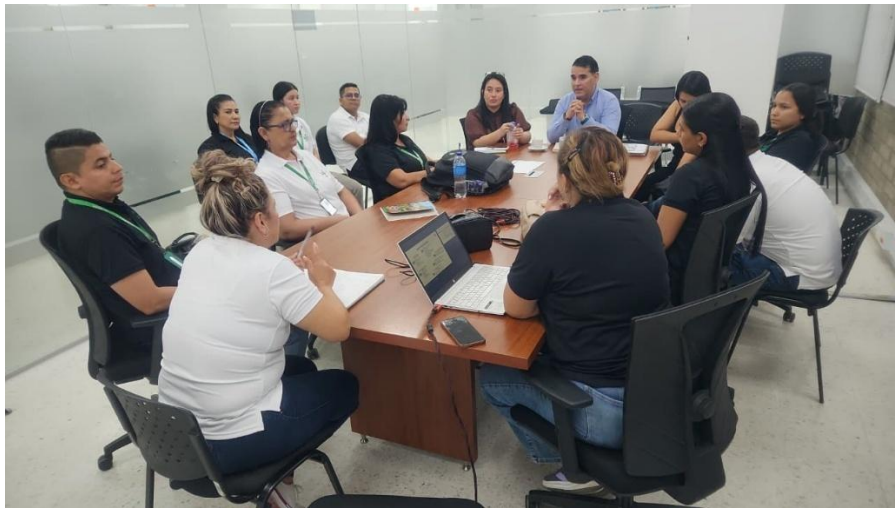
Ilustración 22. Reunión subdirector y equipo de bienestar.

Y las demás que se requieran en articulación con la Dirección de Formación Profesional para el cumplimiento del objeto contractual.