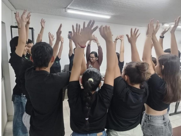
Ilustración 9. Actividad lúdico- pedagógica con formación asignada.