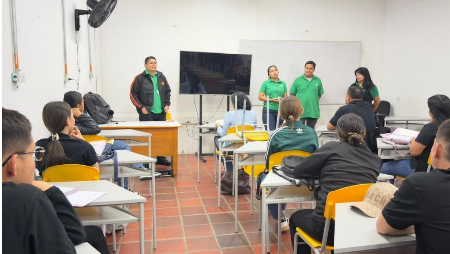
Ilustración 13. Actividad lúdico- pedagógica con formación asignada PESCADERO.